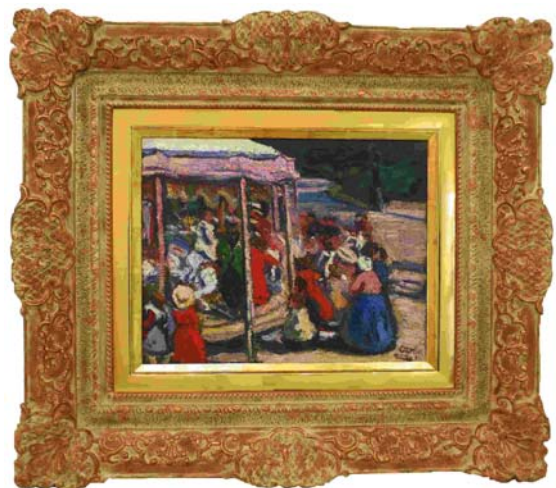
CZÓBEL BÉLA: Körhinta, 1904, olaj, vászon, 37x47 cm

A több mint száz éve lappangó és elveszettnek hitt Czóbel-festmény felbukkanása és leütési rekordja már a múlt év végén is szenzációt okozott a BÁV műtárgyaukcióján. A Körhinta (Ringenspiel) című kisméretű olajképet a fiatal Czóbel Béla még a múlt század elején Párizsban festette – szignója alatt a '904-es évszám látható. A napsugaras, kora őszi hangulatot árasztó, tarka színpoltokból összeálló kép a Luxembourg-kert egyik körhintáját ábrázolja. Az 1904-ben készült művet összesen kétszer állították csak ki, azután korán nyoma veszett. A véletlennek köszönhetően először egy budai lakás eladásakor került elő, majd egy restaurátor úgy megtisztította, hogy a kép intenzív színei újra láthatóakká váltak. Most ez a kép került január 13-tól ideiglenesen Szentendrére.