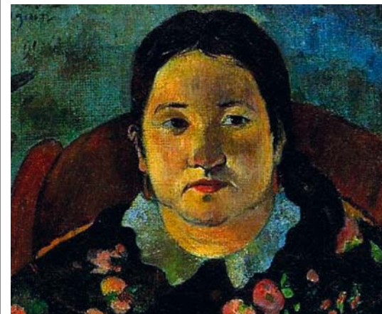
PAUL GAUGUIN: Suzanne Bambridge portréja, 1981, 50x70 cm, olaj, vászon

A Belvedere múzeum Gustav Klimt A csók című világhírű festményének háromdimenziós, kicsinyített változatát készítette el, hogy a mű vakok és látássérültek számára is megtapasztalható legyen. A két év alatt elkészült, a befogadást megújító projekt lényege, hogy a domborműv alakított műalkotás bizonyos részei képesek az emberi tapintás felismerésére, és ennek hatására hangos információkat adnak a képrészekről.