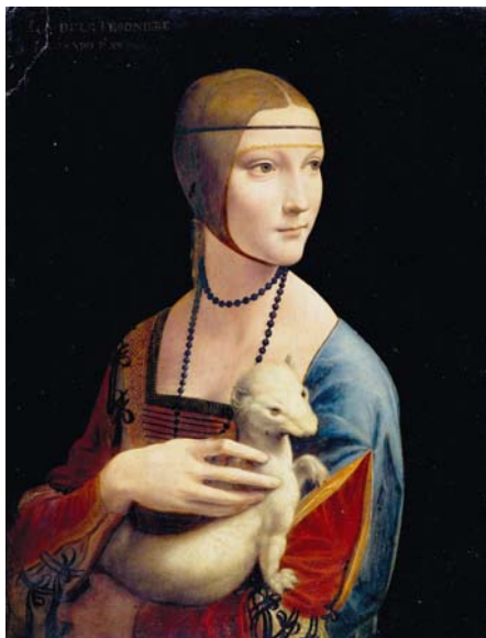
LEONARDO DA VINCI: Hölyg hermelinnel, 1489–1490, olaj, vászon, 54x39 cm