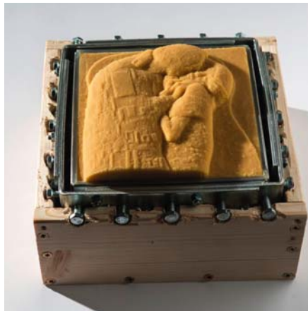
HUNGART © 2017