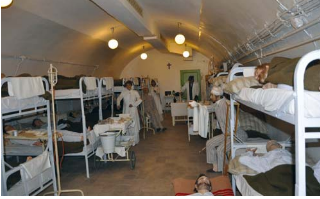
A Sziklakórház Atombunker Múzeum enteriórja