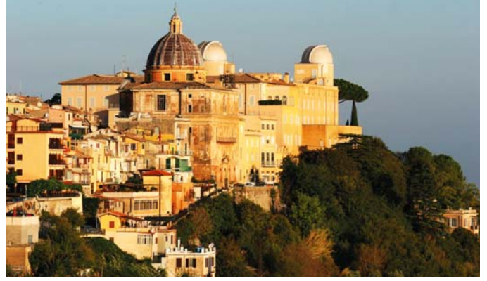
A Gandolfo-palota épülete