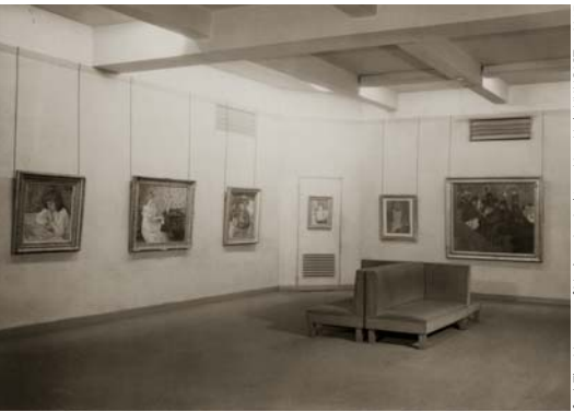
TOULOUSE-LAUTREC, REDON kiállítása, 1931 The Museum of Modern Art

A belga Királyi Szépművészeti Múzeum adományokat gyűjtött Gauguin 1891-es, Suzanne Bambridge-ről készült portréjának restaurálására. A festmény felújításának 45 ezer eurós költségének a felét, azaz 22 500 eurót kellett online felajánlásokból összegyűjteni, ami a vártnál sokkal hamarabb, napok alatt sikerült. A költség másik felét a Baillet-Latour Alapítvány vállalta.