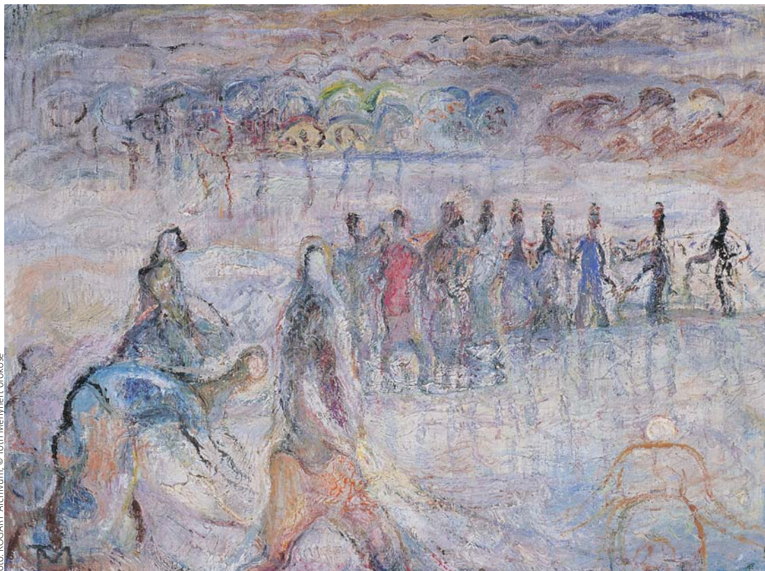
TÓTH MENYHÉRT: Halászat, 1960, olaj, vászon, 60x80 cm

A földszinti csarnokon – Czöbel Béla két műve és Batthyány Gyula Villanegyed című vászna mellett – áthaladva jutunk be az első földszinti terembe, ahol Vaszary János tizennégy alkotása illusztrálja életművének sokszínűségét és invenciózusságát.