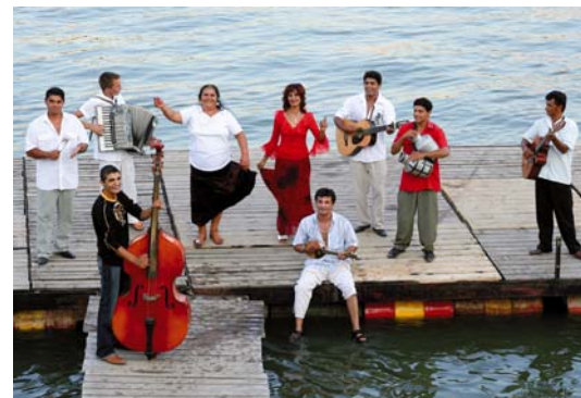
PARNO GRASSZ, 2015

Itt a kilencedik alkalom! A „Katlan” őrzi immár létező hagyományait, és közben mindig szolgál újdonságokkal. A szervezők alapvető célja változtatlan: a művészeti ágak legjobbait hívják meg a négy katlanfaluba, s általuk teremtenek lehetőséget arra, hogy sok ezren találkozhassanak és tölthessenek együtt öt napot. Most is lesznek díszvendégek – Udvaros Dorottya és Kovács Gerzson Péter –, és ez a címke természetesen produkciókat is takar. Az idén különös figyelmet kapnak a fiatal