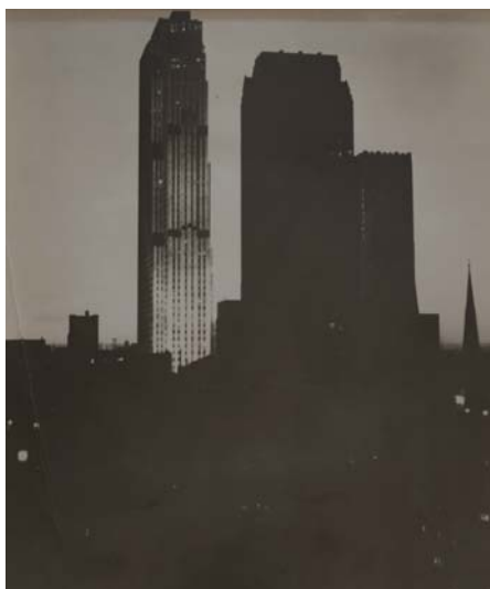
ALFRED STIEGLITZ: New York a Sheltonból, 1935