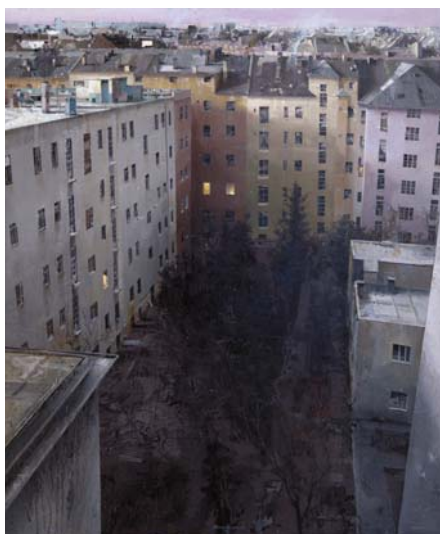
MATTEO MASSAGRANDE: Budapest, 2002, vegyes technika falemezen

Matteo Massagrande a kortárs olasz festészet realista, filozofikus vonulatának nemzetközi szinten is kiemelkedő alkotója. Letűnt korok emlékét idéző épületbelsői és sajátos fénykezelése kapcsolatot teremt múlt és jelen között. Matteo Massagrande Padovában született, és azóta is ebben a városban él, bár több mint két évtizede a nyarakat a Kalocsa közelében fekvő Hajóson tölti, ahonnan felesége származik. Munkáiban így az itáliai művészet évszázados tradíciója összekapcsolódik a magyar táj, a magyar emberek szeretetével, festészetünk tisztelésével.