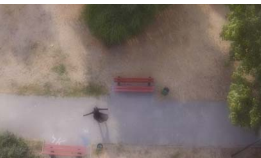
ZUZANNA JANIN: Dance as a Mapping Device (city), 2015, videó, 15 perc

Zuzanna Janin, a Ludwig Múzeum gyűjteményét is gazdagító sokoldalú lengyel művész, főként a videoinstalláció és a szobrászat műfajában járja körül a tér, az idő és a memória kérdéskörét és azok társadalmi vonatkozásait, gyakran építkezve saját életének motívumaiból. A művész az emlékezetet kiindulópontként kezelve, eszközei sokszínűsége és rétegeltsége által annak fizikális és audiovizuális vonatkozásait keresi. A személyes történetek, a családi emlékezet, az idő múlása által ezekben