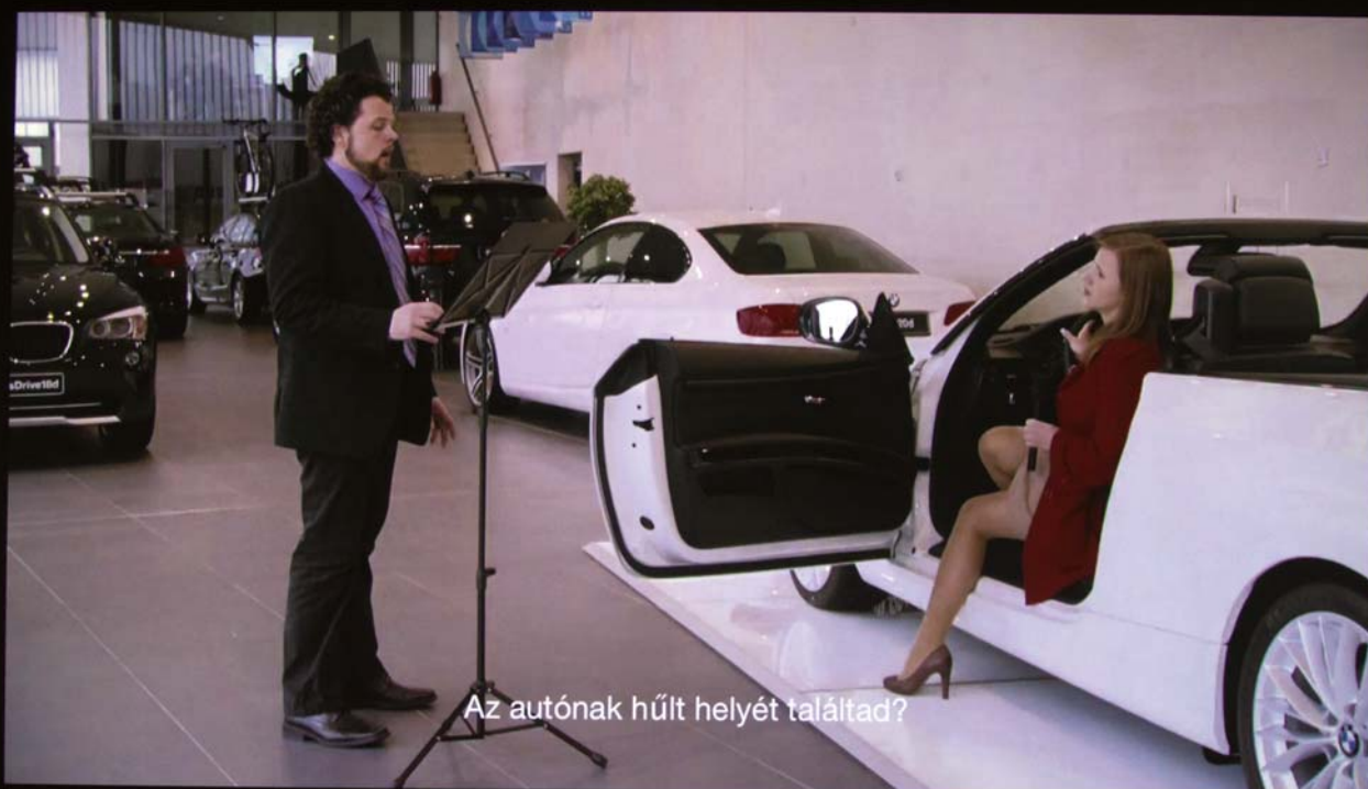
Az autónak hűt helyét találtad?

NÉMETH HAJNAL: Összeomlás – Passzív interjú / Crash – Passive Interview, 2011 kísérleti operafilm 12 részben, újraavagott verzió: 72 perc, full HD, sztereó írta és rendezte: Németh Hajnal