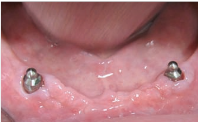
1. ábra. Gömbretenciós fejek lokalizációja megközelítőleg a szemfogaknak megfelelően

Ebben az esetben az implantátumok csak az elhorgonyzásban vesznek részt, a megtámasztást teljes egészében a nyálkahártya-csont alapzat végzi. Az implantátumok nincsenek egységbe foglalva, jellemző lokalizációjuk az anterior régióban, a szemfogaknak megfelelően található (1. ábra). Ilyen megtámasz-