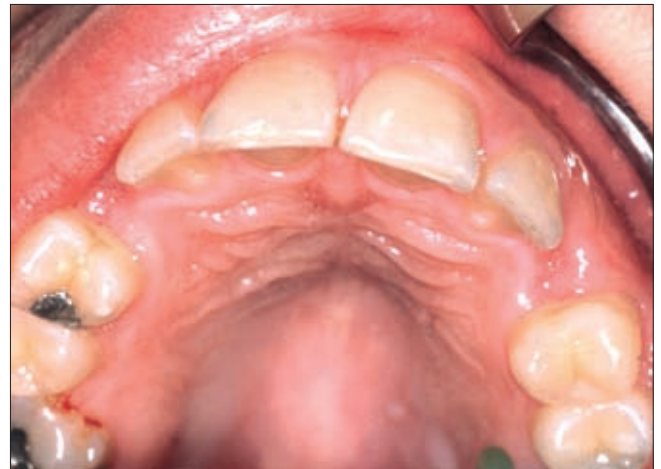
3. ábra. Klinikai vizsgálat a szemfog hiányát mutatja.

cessus alveolarist. Labialisan, felszínesen tapintható, a csontot elődomborító fog esetében a prognózis igen kedvező. A diagnózis felállításában segítséget nyújt, ha a szomszédos fogak mozgathatók vagy diszlokál-