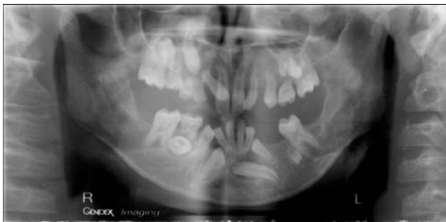
2. ábra. Több fog retenciójának együttes előfordulása

A fogat ért trauma, rendellenes csírahelyzet, számfelleti fogak, daganat, cysta stb. fog előtörési zavart okoz-