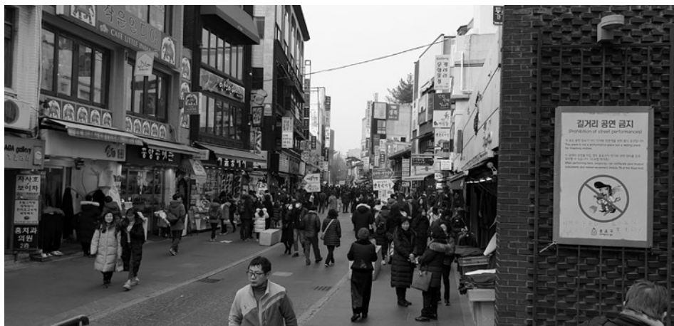
5. kép Cshonggyecheon hagyományos környéke ma sétálóutca és látványosság Photo 5 The traditional neighbourhood of Cheonggyecheon is today pedestrian street and attraction

A 2014-ben létrejött bizottság – CSO MJONG-RE vezetésével – az újbóli rekonstrukciót szorgalmazta, de figyelmen kívül hagyta, hogy a város egy folyamatosan változó közeg. A kritikusok szerint a „tereprendezésnek” degradált városfejlesztés és rekonstrukció viszont a kerület dzsentifikációját eredményezte (5. kép). JEON, C. – KANG, K. (2019) meg is jegyzi, hogy még a városrehabilitáció, a mesterséges tereprendezés legerősebb bírálója, a szociológus CSO MJONG-RE sem említette a környék ipari múltját, azt a társadalmi hely-