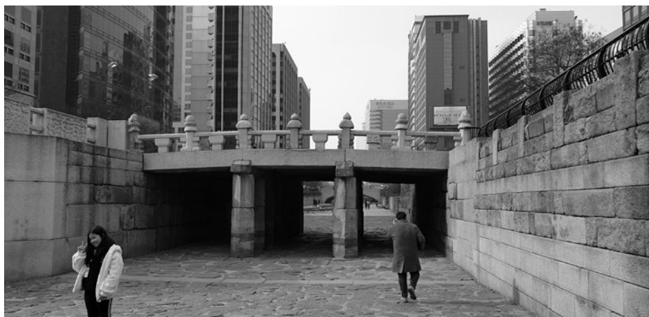
4. kép A Kvantongjo híd és környéke 2019-ben Photo 4 Around the Gwangtonggyo Bridge in 2019

patak, mint említettük, egy szennyvízelvezető volt, környéke pedig nyomornegyed. A befedést követő évtizedekben pedig nem volt mire emlékezni, hiszen a csatorna a föld alá került. Csatorna volt, hiszen természetes vízutánpótlását évszázadok óta elvesztette. A városépítészeti szemlélet szerint a városrész konzerválása olyan referenciára utalt, ami legfeljebb a történelemlékekben volt olvasható.