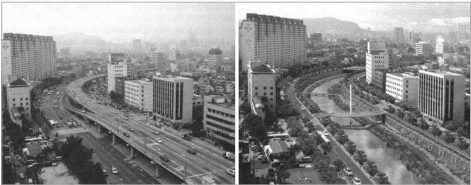
3. kép Cshonggjecshon látképe a sztrádával és a rekonstrukció után