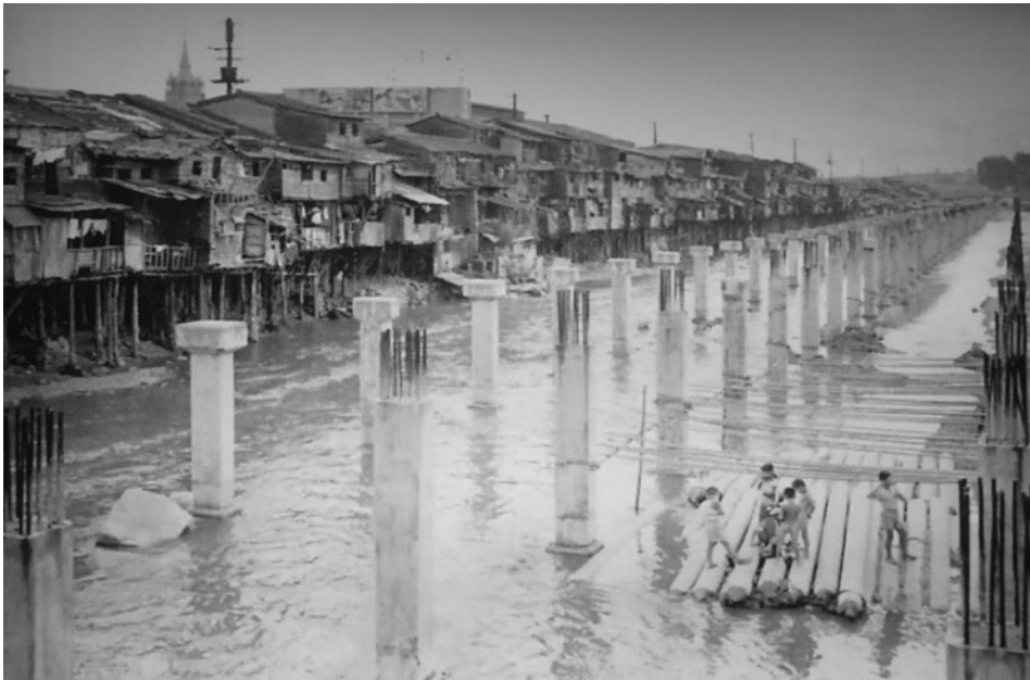
2. kép A Cshonggyecshon patak befedési munkálatai 1958-ban Photo 2 Covering the Cheonggyecheon Stream in 1958