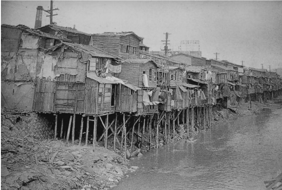
1. kép A háború után, az észak-koreai menekültek által épített viskók a Cshonggyecshon patak mentén Photo 1 Shantytowns built by North Korean refugees after the war, along with the Cheonggyecheon Stream