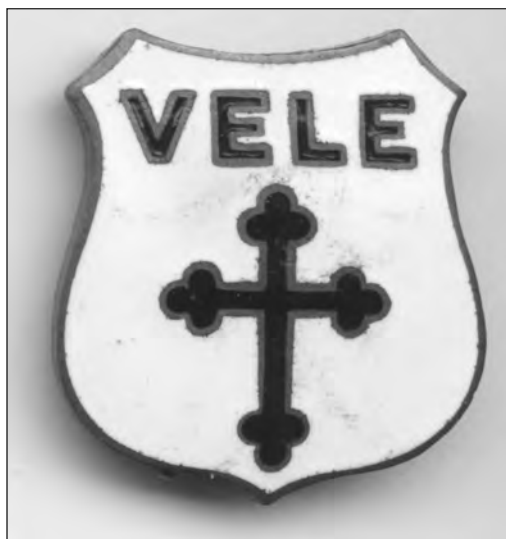
A Leányegyesület jelvénye