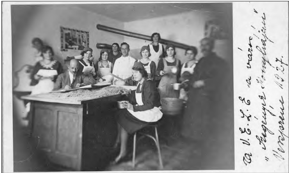
A Leányegyesület tagjai a város Szegények konyháján 1927-ben

A következő évekből 1944-ig alig van néhány, az egyesület által kiadott/készített irat. 73 Ezért a működésük nem rekonstruálható. A beérkezett levelek, felhívások, kérések, ajánlások iktatás nélküliek, ezeket elintézésére vonatkozó egyesületi kommentárral nem látták el.