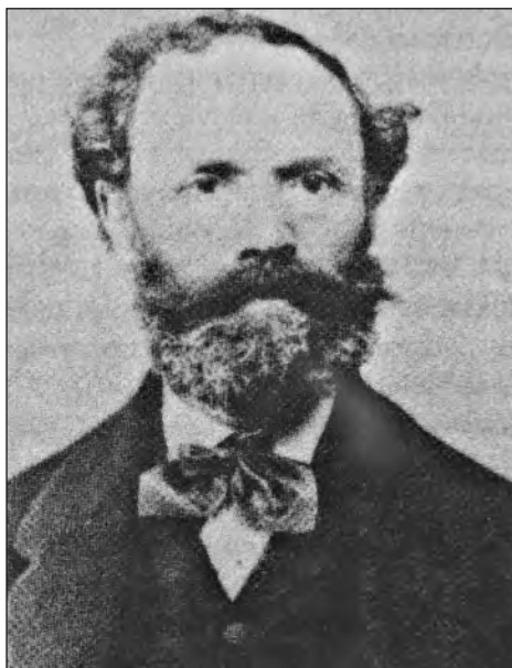
Ridley-Kohne Dávid (1812–1892) hegedűművész, a Nemzeti Zenede tanára, Auer Lipót első fővárosi mestere

egyengette. A Várpalotán született Ney Dávidot (1842–1905), a 19. század kiemelkedő operaénekesét, aki 16 évesen szabóinasként került Veszprémbe, a zsidó templom kántora (Ranschburg) fedezte fel, oktatta zenére és énekelte kórusában. 22