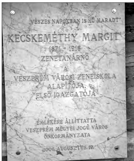
A tűztorony alatti panteonban elhelyezett emléktáblája

nek, ellátta a szükséges berendezésekkel és hangszerekkel. Szakmai segítséget az igazgatónő Gobbi Alajos hegedűtanártól, a Nemzeti Zenede igazgatójától kapott. 43 A tanerőkről az alapító gondoskodott anyagilag is. 44