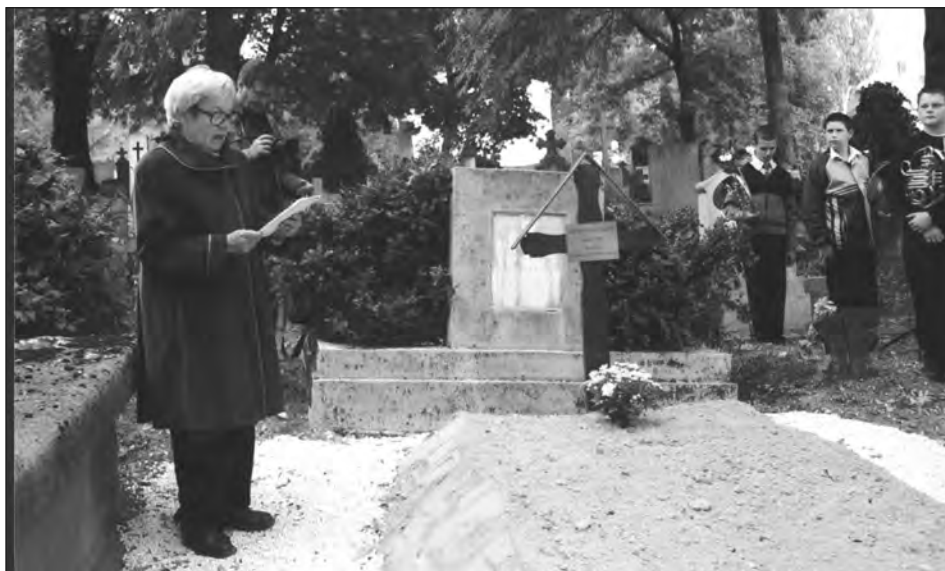
Az alsóvárosi temető sírdombja

temető kápolnájából kísérték nyughelyére. 59 A korán elhalt húga és szülei mellé temették. 60