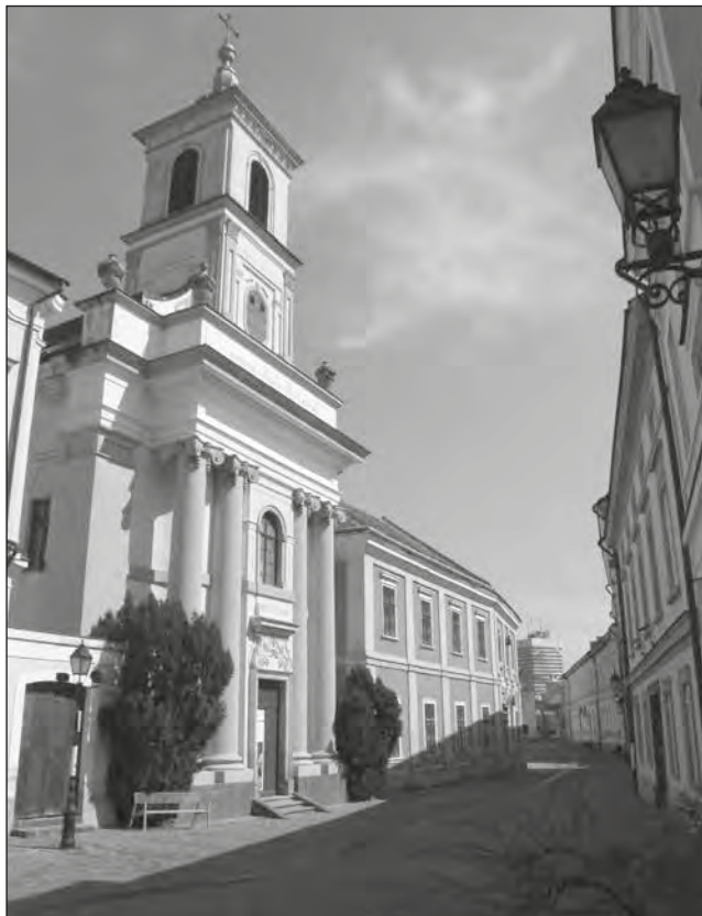
A piarista templom és a rendház

A gimnázium nem csak egy iskola volt, hanem egy értékközvetítő szellemi műhely, ahol kiváló tanárok és szerzetesek alapozták meg a város társadalmának műveltségét, közéletét és hitéletét. A szellemi örökséget két intézmény is büszkén vállalja: a Lovassy László Gimnázium és a Padányi Biró Márton Római Katolikus Iskola.