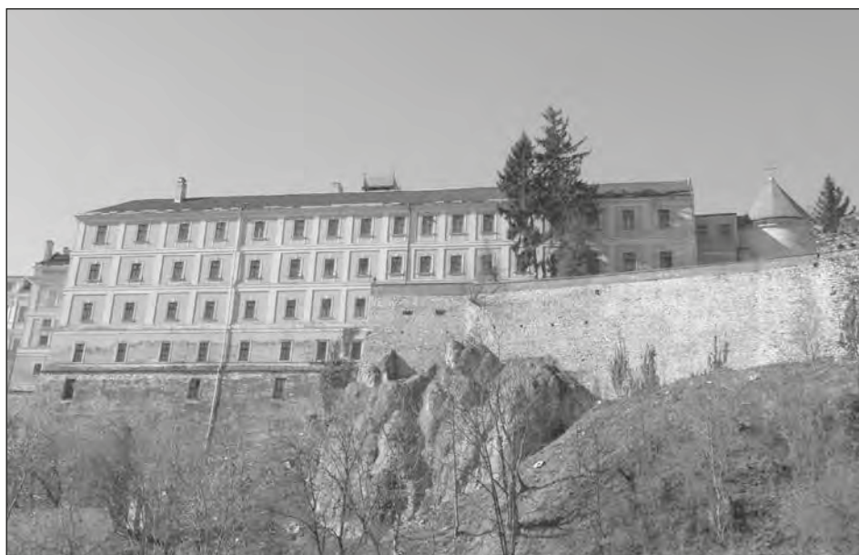
Iskolaépület a Buhim felől