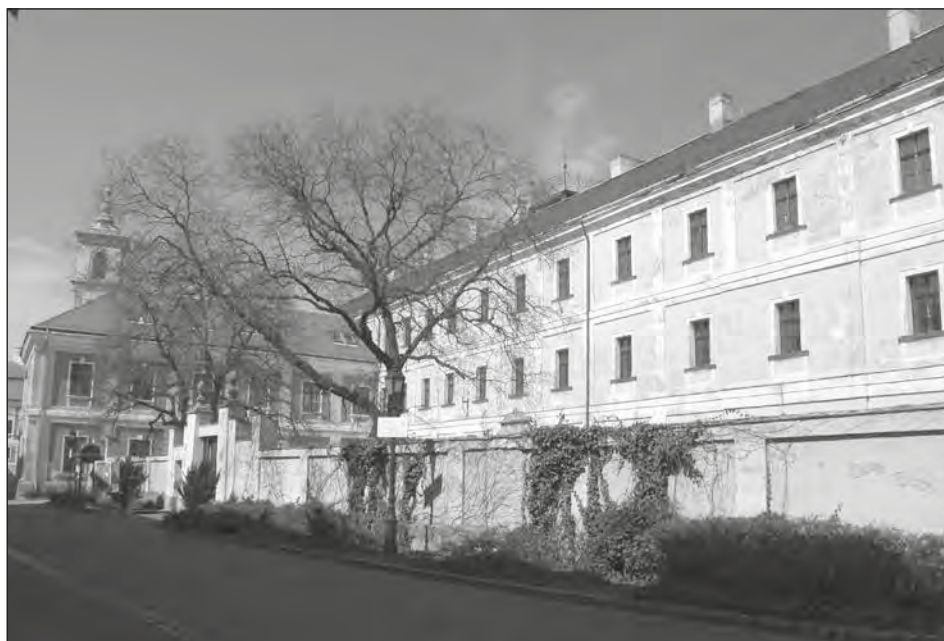
Iskolaépület a Vár utcában