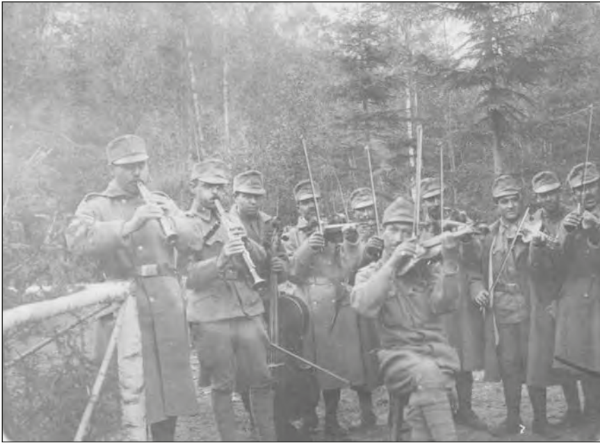
Magyar honvédek cigánybandája az I. világháborúban. 69.140.

A banda 1917. május 23-ai kostenjavicai harcokban (X. isonzói csata) való részvételére Herczegh Géza honvéd alezredes, a 31-es ezredtörténet írója így emlékezett vissza 1936-ban: