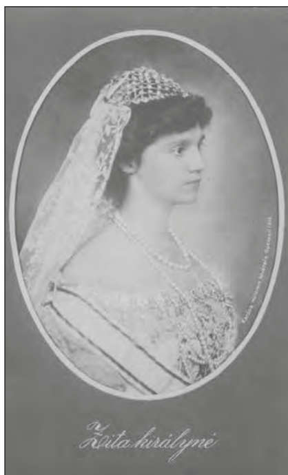
Zita királyné (1892–1989) a koronázás napján, Budapest 1916. dec. 30. 91.411.1.