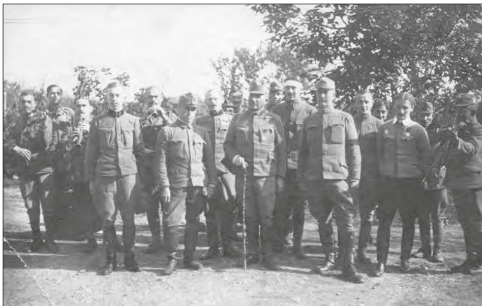
Osztrák–Magyar katonatisztek (középen egy vezérőrnagy bottal és egy ezredes karszalaggal) katona cigányzenészekkel, 1917–1918.

LDM Történeti Fényképgyűjteménye 89.1.3.