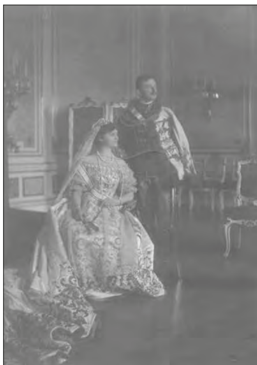
IV. Károly Király (1887–1922) és Zita királyné (1892–1989) a koronázás napján a budai királyi palotában, 1916. dec. 30. LDM Történeti Fényképgyűjteménye 91.3.1.

Ebből a vonzódásból származott az a jogi viszony, amely szerint a veszprémi püspök e királyné kancellárja s a koronázásakor, a királynét a veszprémi püspök koronázza meg. 6 A kancellárság ma már csak papiros emlék, de a koronázás joga ma is élő jog. Tanui voltunk ennek legutobb, midőn boldog emlékü Hornig 7 bíboros a jelenleg uralkodó király nejét megkoronázta. 8