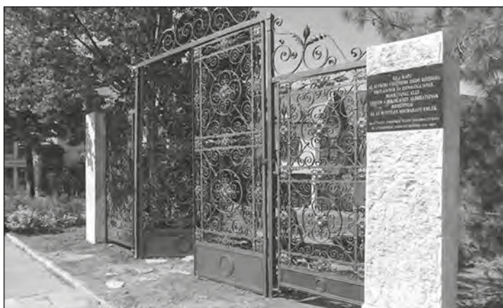
A kapu.