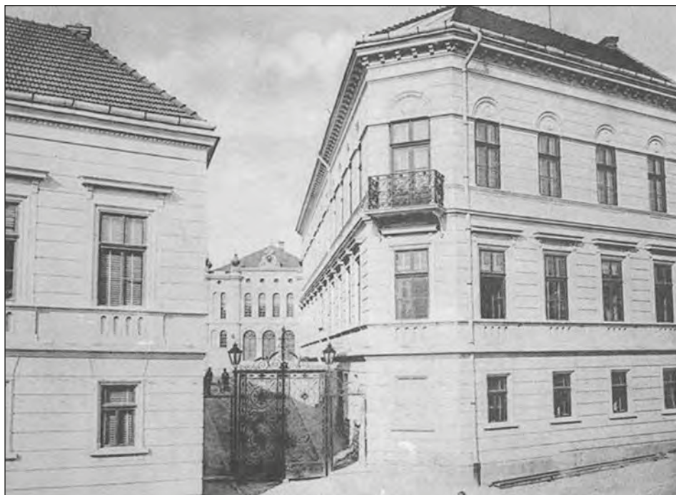
Az egykori zsidóiskola látképe.