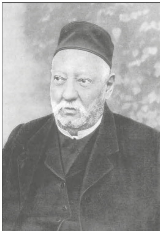
A „Vajda”, Eötvös Károly az 1910-es évek elején

volt lehetőség valamennyi sajtóteremk feldolgozására, külföldön megjelent újságokhoz sem jutott a szerkesztő-könyvtáros. Rendkívül jelentős munka, emeli értékét az autopszia elvén alapuló felvétel. A kötet legutolsó részében Kosztolányi, Schöpflin Aladár, Krúdy Gyula, Karinthy Frigyes színes értékeléseit, méltatásait olvashatjuk. 37