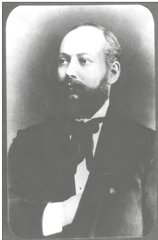
Eötvös Károly a tiszaezlári per idején 1883-ban

1871. év végén a veszprémi királyi törvényszék mellé közzvádló királyi ügyésznek nevezték ki. 1872-ben a veszprémi választókerület országgyűlési képviselőjévé választották, az ún. Deák-párthoz csatlakozott. Ez időben a párt főlapjának, a Pesti Naplónak a vezércikkírója is volt. 1876-ban a Széll Kálmán-féle pénzügyminisztériumban volt állásban, de a gazdasági kiegyezéssel nem tudott kibékülni, ezért lemondott, visszavonult, a birtokain gazdálkodott és az ellenzéket vezette. 1877 végén a fővárosban ügyvédi irodát nyitott. 1878-ban a veszprémi kerület újra országgyűlési képviselőjévé választotta, Eötvös a Függetlenségi Párthoz csatlakozott. 1881-ben Nagykovács és Dunavecse országgyűlési képviselője. 14