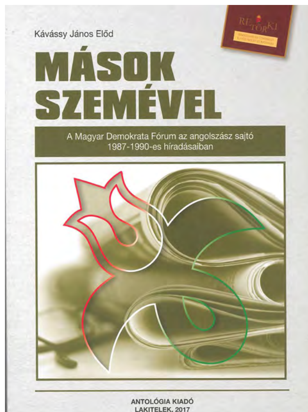
Kávássy János: Mások szemével