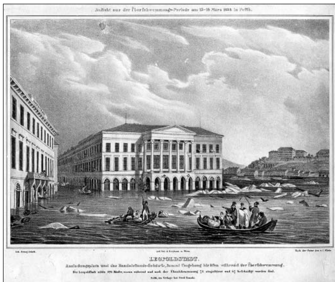
A lipótvárosi Kereskedelmi Kar környéke az 1838-as árvíz idején, Georg Scheth és Klette Károly litográfiája (Magyar Nemzeti Múzeum, Történelmi Képcsarnok)

Árvízi naplója azért különösen érdekes számunkra, mert annak lapjait olvasva a pesti árvízi védekezésben kiemelt szerepet vállaló két fontos tiszt-