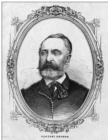
Tanárky Gedeon idős korában (Magyar Nemzeti Múzeum, Történelmi Képcsarnok)

töltött, gyakran fordult meg a család kastélyaiban, így a Bihar megyei Nagykágyán és a Bereg megyében lévő Lónyán. Meghitt, bensőséges kapcsolat jött létre az ifjú jogász és a népes család tagjai között, a két serdülő korú Lónyay-fíú, Albert és Menyhért, valósággal rajongott érte. 1840 nyarán velük együtt egy hónapos erdélyi körutat tett, hogy megismerje végre az oly annyira látni vágyott, szeretett testvérházát. Szinte magától értetődő tehát, hogy az árvízi rettenet napjaiban Tanárky volt kenyéradó gazdájáról, az immáron fontos bizalmi tisztségre, az árvízvédelmi intézkedések és a mentési munkálatok megszervezésére kinevezett királyi biztosról is megemlékezik naplójában, ha kissé szűkszavúan is.