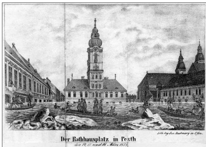
A pesti Városháza tér az 1838-as árvíz napjaiban, Szakmáry József litográfiája (Magyar Nemzeti Múzeum, Történelmi Képcsarnok)