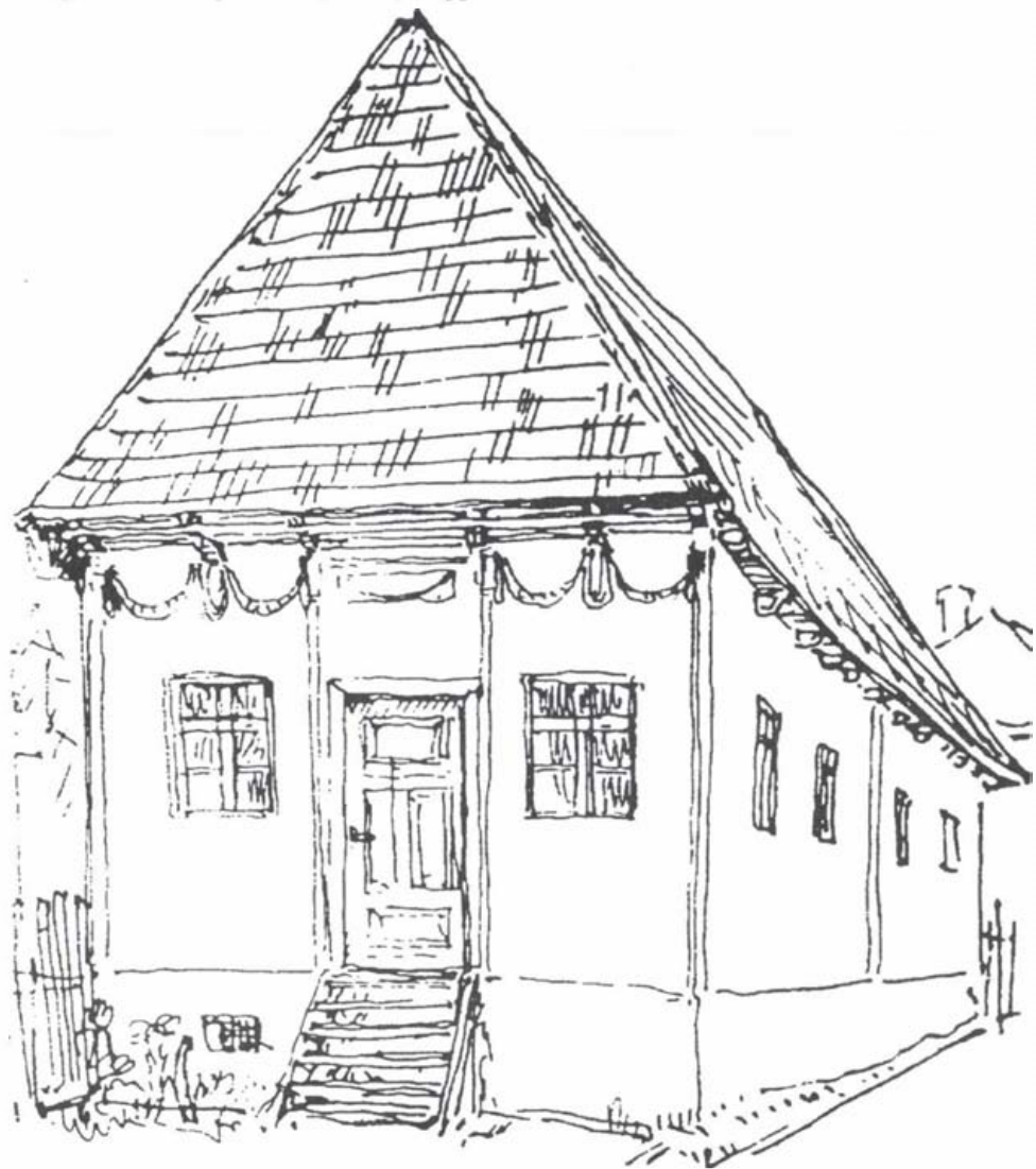
Empire díszítésű lakóház az Ereg utca elején (lebontva az 1970-es években)

Így tűnt el a népi építkezés számos emléke is, amelyek különböző építészeti stílusokat képviseltek. Mind a középkori városmagban (a Vártemplom környéke), mind pedig az évszázadokig különálló régi Szemerja falu jelleggel bírt.