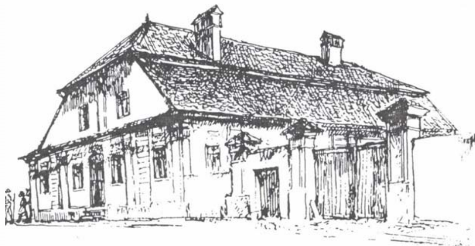
Az empire díszítésű Bálház

Városunk fennmaradt legrégebb egyházi épületegyüttese a Vártemplom és az azt körülvevő erődítményrendszer. A templomot körülvevő belső várfal a XV., a külső várfal pedig a XVI. században épült. Az 1658-as és 1661-es török és tatárdúlások megrongálták a várfalakat. Az 1802-