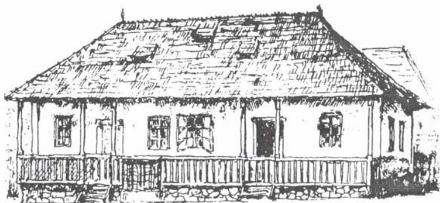
Népi ikerlakás a Puskás Tivadar utcában