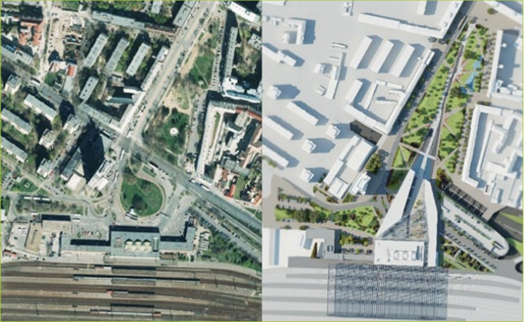
3. ábra: A Petőfi tér jelenlegi kialakítása és a tervezett IKKK

ipari egység még tovább növeli az utca népszerűségét. Ebből kifolyólag a város vezetése elkötelezte magát amellett, hogy a Piac utcát, a vasútállomás és a Nagytemplom közötti teljes hosszában sétálóövezetté alakítja át az elkövetkező néhány évben. Ha az IKKK a belvárosi térrendszerhez közelítően és összekapcsolhatóan valósulna meg, akkor kialakulhatna a két hangsúlyos végpont közötti gyalogos övezet, így a Piac utca teljes hosszában városközpontként lenne definiálható. Ha az új közlekedési központ ettől a zónától valami miatt leszakad, úgy önálló szatellitként működne, azaz oda már csak közlekedési eszközökkel lenne érdemes eljutni. Ez esetben a Piac utca meghatározó része véleményem szerint elhalna.