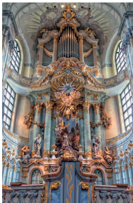
A templom belseje

A Frauenkirche tornyaiban nyolc harang lakik, többségüket 2003-ban öntötték, a legnagyobb 1,75 tonna súlyú. A régi, híres Silbermann-orgona elpusztult, sípjait nem lehetett rekonstruálni. Az oltár felett elhelyezkedő, új orgona négy manuális. 67 hangzó regisztere és csaknem 5000 sípja van. A templomban istentiszteleten kívül hangversenyeket, előadásokat is tartanak.