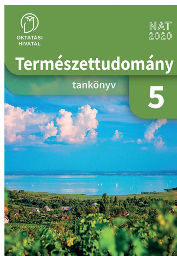
Az Oktatási Hivatal által 2020-ban kiadott, a NAT2020-ra épülő tankönyv

A természettudományos tárgyakat a tanulók korához, a hétköznapi tapasztalásaihoz igazodva kell/kellene tanítani. Az általános iskolákban lehetne ezeket a tárgyakat egymáshoz szorosan kapcsolatosan oktatni, mindig utalva a jelenségeknek a mindennapokban való előfordulására, kitérve a hétköznapi élettel való szoros kapcsolatukra is. Arra is szükséges felhívni a figyelmet, hogy ezek a jelenségek, anyagok, történések hogyan befolyásolják életünket, milyen hasznos vagy káros hatások fűződnek hozzájuk, illetve ez utóbbi esetben mit tehetünk/teszünk a káros következmények csökkentése érdekében. Ne hagyjunk a tanulóknak negatív képet a természettudományok hatásával kapcsolatosan! Van pozitív tapasztalatom is ezen a téren: 5. osztályos unokám újonnan kiadott Természettudomány tankönyve ennek a kívána-