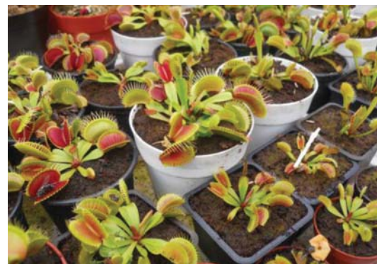
4. ábra. A húsevő kancsókák virágszerű szépsége

Az írás elején említettük: Charles Darwin fedezte fel, hogy ezek a növények befogják és megemésztik élő rovarokat.