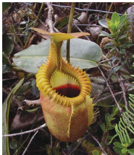
1. ábra. A kancsóka húsevő növény viráglevele (csapdája)

kívánunk kitérni, de példaként egy húsevő növény családot, a szegfűvirágúak rendjébe tartozó kancsókat röviden megemlítünk. A kancsóka vagy kancsóvirág (tudományos neve, a Nepenthes görög eredetű: né = tagadó előtag, penthes = bánat, szomorúság) a szegfűvirágúak ( Caryophyllales ) rendjébe tartozó kancsókafelek családjának egyetlen nemzetsége. Nevét a rovarfogás céljaira kancsó alakúvá módosult levelekről kapta (1. ábra). Ez a trópusi indás faj Dél-Kínában, Indonéziában, Malaj-