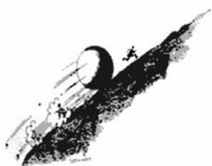
Kép szöveg nélkül (The New Yorker, 1963)

Mind a tudományos, mind pedig a köznapis folyóiratokban nagy számban találhatunk tudományos vonatkozású rajzokat, karikatúrákat. A legnevesebb és legtermékenyebb rajzolóik közül Sidney Harris, akinek kötetre való tudományos vonatkozású rajza jelent meg. [42]