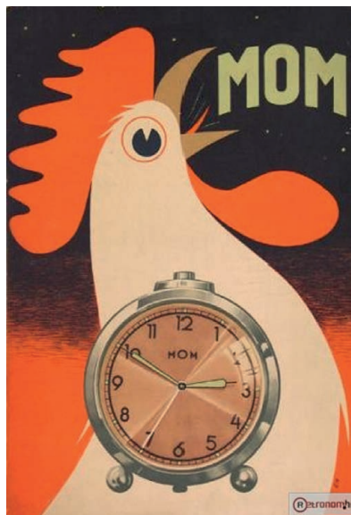
MOM-órák (retronom.hu, [14])