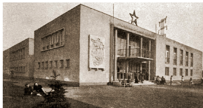
A Hazai Fésűsfonó és Szövőgyár kultúrháza az 1950-es években [18]

A kultúrházat ifj. Dávid Károly (1903–1973) tervezte, aki az 1930-as évek elején Le Corbusier irodájában töltött majdnem egy évet. Két munkáját szinte mindenki ismeri. Az egyik a (ma már szintén műemlék) Ferihegy I. terminál, amelynek építése az 1930-as évek végén kezdődött, de a repülőteret – a háború miatt – csak 1950 májusában adták át. A másik a Népstadion (Puskás Ferenc Stadion). Dávid Károly 1950-ben három kultúrházat is tervezett. [16] Az egyik a Hazai Fésűsfonó és Szövőgyár kultúrháza, amelyben ma irodák vannak. A gyár többé-kevésbé romos épületeinek egyikébe viszont beköltözött a kultúra; itt működik a Bakelit Multi Art Center. A Fésűsfonó kultúrházára nagyon hasonlít a Pamuttextilműveké, amelyet 1950. december 21-én – Sztálin 71. születésnapján – adtak át a gyár dolgozóinak. [17] Ez a kultúrotthon az 1960-as évek elején Fővárosi Művelődési Házzá (FMH) alakult át; az idők folyamán legendás kulturális központ lett (itt működött például az Illés Klub). A