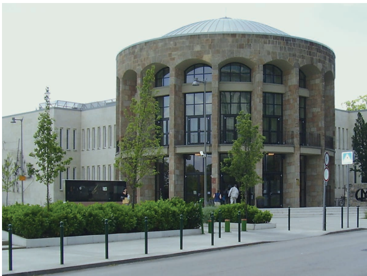
A MOM Kulturális Központ napjainkban

60 éves épületet néhány éve lebontották, és 60 lépésnyire újat építettek helyette.