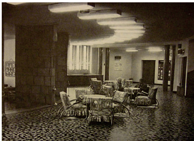
A MOM-kultúrház előcsarnoka, archív felvétel [20]

például az úttörő- és a szakszervezeti szoba, a Magyar Nők Demokratikus Szövetségének irodája; az emeleten a játék-, a sakk-, a sportszoba, a könyvtár, a fotólabor. [15] Az időközben Szakassits Árpádról elnevezett intézmény programjai szintén tükrözték a kettős törekvést: „Az 50–60-as években az igényeknek megfelelően hivatalos színházi együttesek tartottak előadásokat. Ma-napság is [1976] él ez a szép hagyomány ... Olyan tömeggyűléseknek is gyakran adott helyet kultúrpalotánk, amelyeknek szónokai a hazai, illetve a nemzetközi politika jelentős személyiségei voltak.” [19] A bizományi áruház művészeti aukcióit hosszú évekig a MOM-kultúrházban rendezték meg. A dolgozók képzését szolgálta például a jellegzetes nevű Munkásakadémia, Nők Akadémiája, Társadalompolitikai Akadémia (ahol arról tartottak először előadást – 1976 novemberében –, hogy milyen szerepet töltenek be a műholdak a világrészek közötti információcserében). A kultúrház vezetésének fontos volt a fiatalok bevonása: 1976-ban hetente játszott a Beatrice (ekkor még nem érkezett el a kemény rockhoz), később itt alakult meg a Hobo Blues Band első klubja.