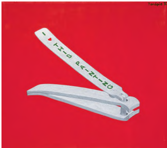
Hecker Péter: Terápia V. , akril, vászon, 80 × 92 cm, fotó: © Garas Kálmán / HUNGART © 2021