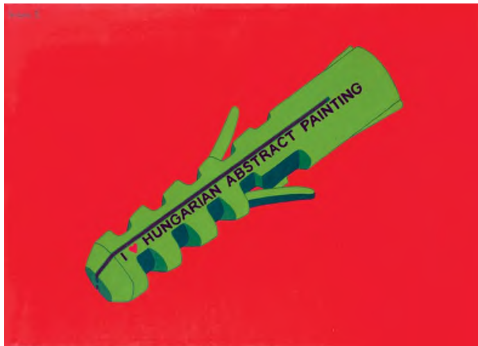
Hecker Péter: Terápia II. , akril, vászon, 80 × 110 cm

című festménye már a kép önálló autoritását tudatosítja, azaz a kép nem egyenlő azzal, amit ábrázol. A szavak és képek vagy épp a szavak és dolgok – ahogy Foucault Magritte képét elemző könyvének címe is mondja – eléggé változatos viszonyban állnak egymással. Akár értelmezhetik is egymást, de lehetnek a különféle médiumok tudatosításának is az eszközei – mint például Magritte esetében. Egyáltalán, mennyire alkalmasak, sőt alkalmasak-e a szavak arra, hogy a látványról beszéljenek? De nemcsak a szavak és a képek viszonya ilyen bizonytalan vagy ambivalens, hanem mindkettőnek a valósághoz való viszonya is. Ahogy például Joseph Kosuth híres Egy és három szék című munkájában is szemlélteti: egy valódi szék lényegét se annak definíciója, se fotografikus képe nem tudja visszaadni, mind a három egészen más marad.