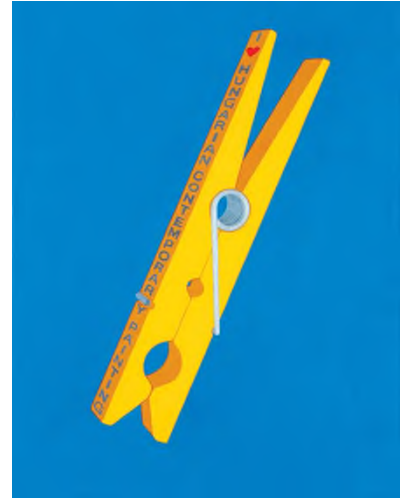
Hecker Péter: Terápia I. , akril, vászon, 100 × 75 cm