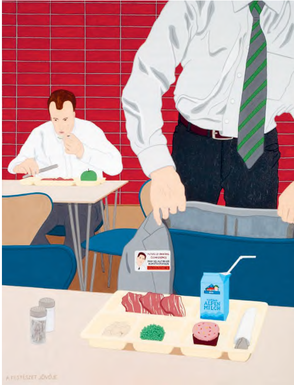
Hecker Péter: A festészet jövője , akril, vászon, 130 × 100 cm, fotó: © Garas Kálmán / HUNGART © 2021