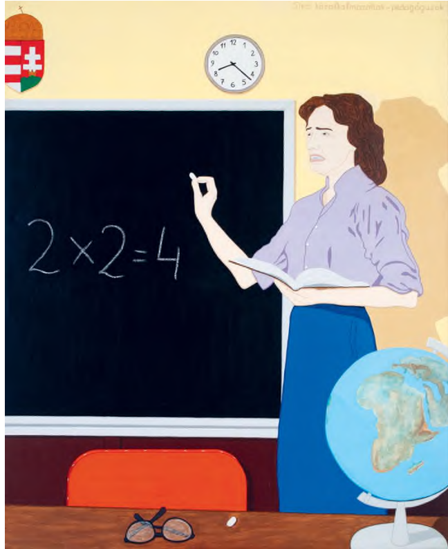
Hecker Péter: Síró közalkalmazottak – Tanárok , akril, vászon, 145 × 118 cm

repültek, arra következtethetünk, hogy a behatás nagy erejű volt. De a kérdés, vajon milyen (fiktív) bűncselekmény történhetett, nyitva marad, a néző csak találgathat. (A kép a képben motívum egyébként a sorozat külön érdekessége, számos művészettörténeti előzménnyel.)