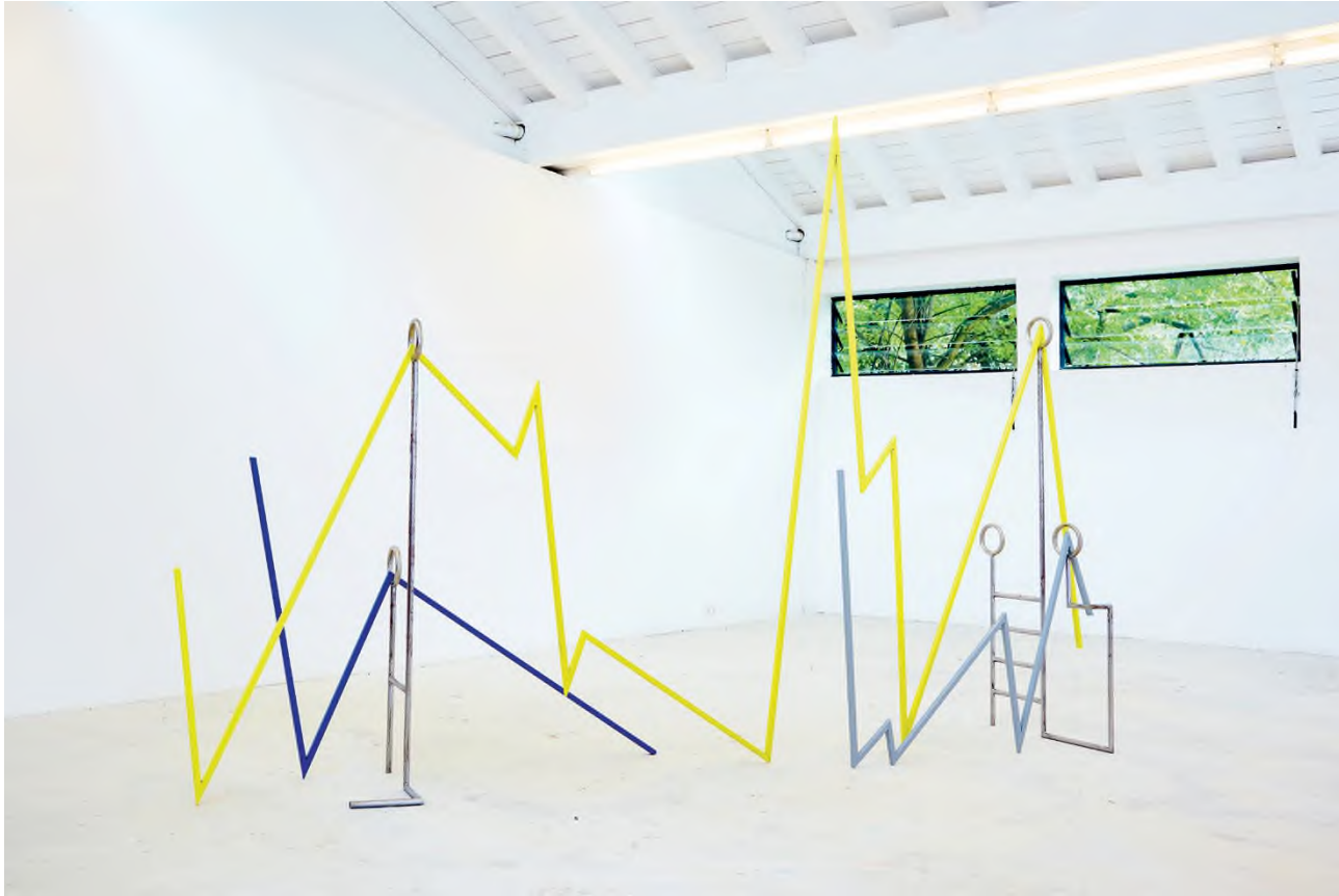
Molnár Zsolt: Növényi stressztérkép , 2018, vas, szinterezett vas, 379,2 × 241,8 × 59,1 cm

És valóban, ezek a térbeli vonalrendszerek, amelyek a mai napig munkáinak egyik komponensét adják, legalább annyira táplálkoznak a grafikus látásmódból, mint a klasszikus értelemben vett szobrászati problémákból. Másik alapvető tulajdonságuk az, hogy nem ábrázolnak. Ehelyett tudatosan hívnak elő olyan asszociációkat, mint a növekedő növények csavarodó mozgása, vagy idézik meg a természetben megjelenő mesterséges anyagok esztétikáját, a permetezőgépek rideg funkcionalitását. Egyedül a formák és anyagok által keltett érzeteken, képzettársításokon keresztül kapcsolódnak a grafikákon még sokáig felismerhetően megjelenített témához.