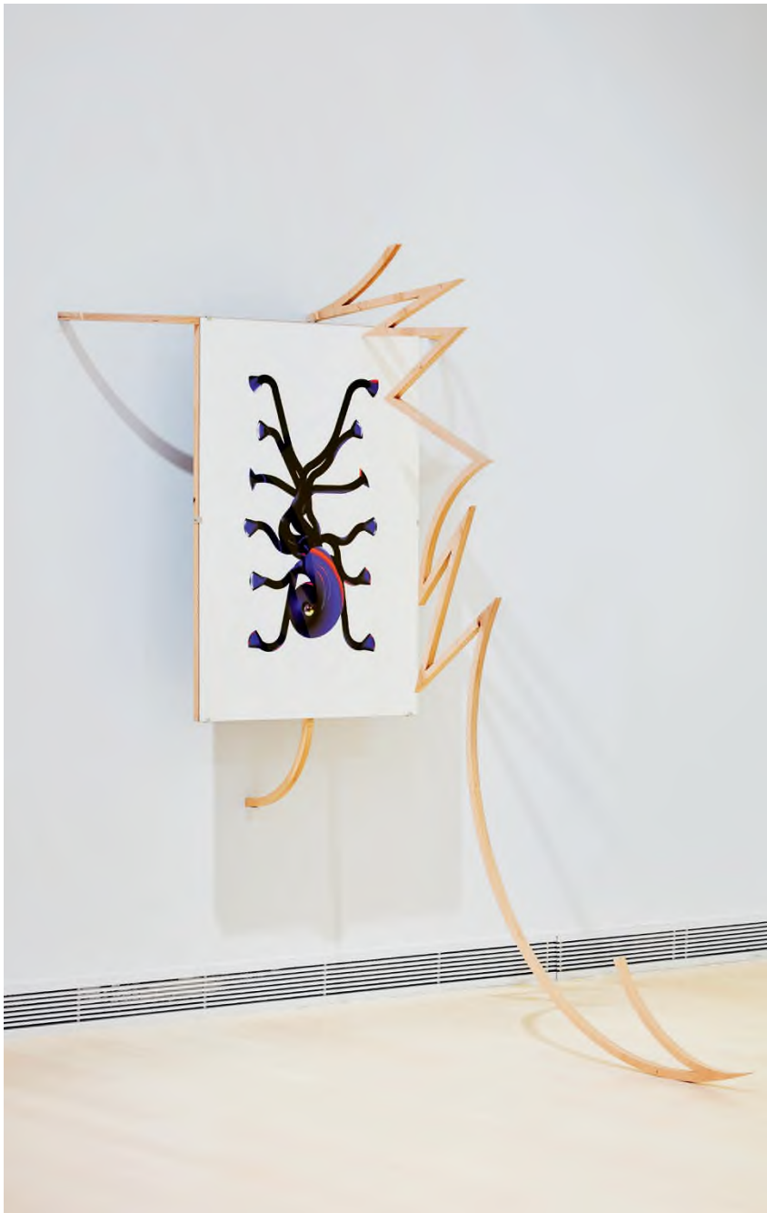
Molnár Zsolt: Vineyard Sprayer (Szőlőpermetező), 2019, giclée print, papír, kollázs, rétegelt lemez, plexi, 171 × 198 × 150 cm

Ahogy az elején utaltam rá, Molnár Zsolt művei az emberi kultúra és természet dichotóm kettéválasztásával szemben foglalnak állást. Ennek számomra legmegfoghatóbb bizonyítéka pedig éppen az, ahogyan az ellentétes minőségek kapcsolatával foglalkozik. Az ellentétpárok – mint a virtuális és a kézzelfogható realitásból származó, elvont és konkrét, manuális és digitális, organikus és geometrikus, szerves és szervetlen vagy akár forma és tartalom – közötti feszültségeknek sosem feloldására, eltüntetésére, hanem éppen felmutatására és összehangolására törekszik. A különböző ontológiájú dolgok elvitathatatlan létezésére és egyszerre azok szétválaszthatatlanságának kifejezésére törekszik. A világban jelenlévő ellentmondásokat és