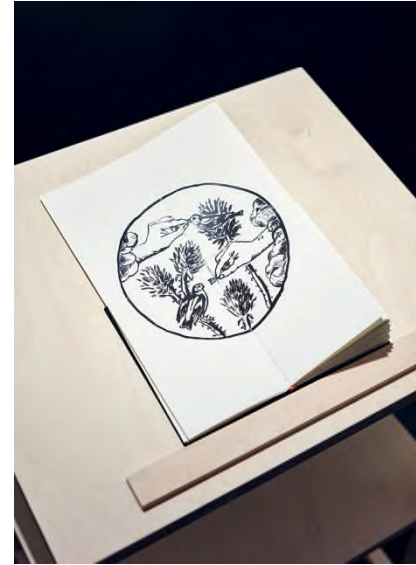
Gosztola Kitti Ut fringilla című installációjához tartozó Tengelic apokrif művészkönyv egy oldala

jelenik meg a kiállítótérben. A darwini ábrára emlékeztető elrendezés a tengelic különféle területek táji és időjárási viszonyaira adaptálódott fajait mutatja be. A számos térségben végbemenő evolúció csak fikció, valójában mégsem áll messze a valóságtól: az alapja a Darwin által vizsgált galapagosi pintyek csőrformáinak változása, amely állítólag fontos szerepet játszott az evolúciós elmélet kidolgozásában. Egykor „Darwin pintyeit” és a tengelicet is a pintyfélékhez sorolták, mára azonban ez meghaladott teóriának számít.