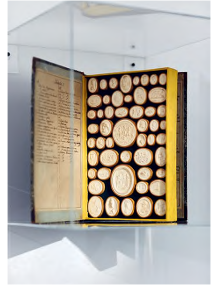
Dactyliotheke, káma- és gemmamásolatok gyűjteménye, Pannonhalmi Főapátság numizmatikai gyűjtemény, Pannonhalma