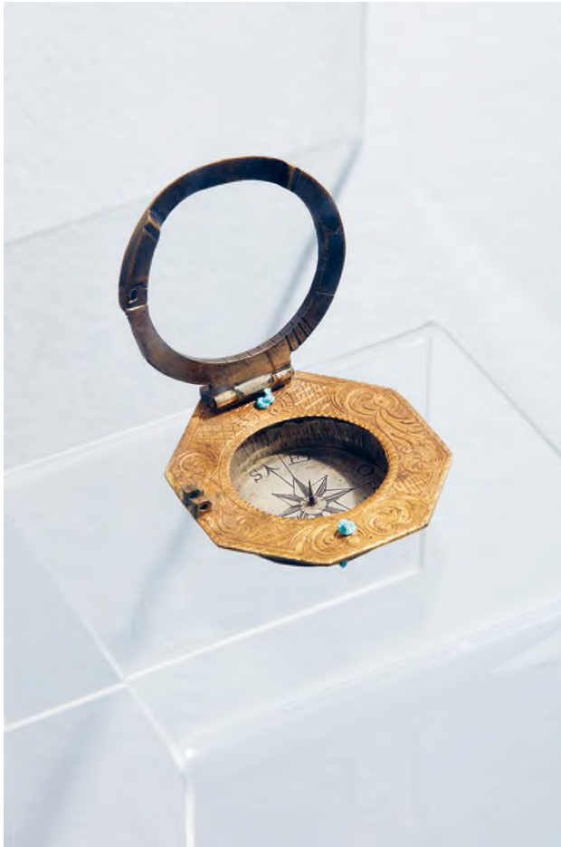
Íránytű/napóra, 19. század vége, réz, acél, 5,5 × 5 cm, Pannonhalmi Főapátság műtárgygyűjtemény, Pannonhalma