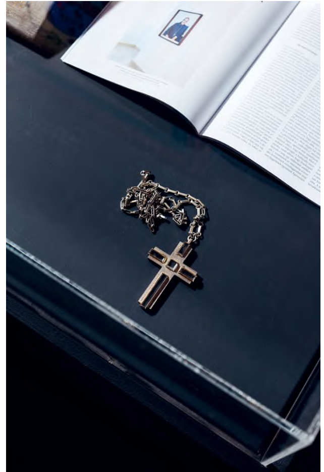
Várszegi Asztrik OSB főpapi mellkeresztje, valamint egy nyitott Artmagazin, benne Lábady István Várszegi Asztrikról készített főapáti portrójáról szóló cikkünkkel

azonos ideák és lelkület mentén épült több száz éven keresztül. A Pannonhalmi Könyvtár Magyarország legrégebbi gyűjteménye – és erre Szent László király az apátság vagyonát 1090-ben leíró oklevele a bizonyíték. Ebben az oklevélben szerepel a könyvtár akkori, nagyjából nyolcvan kötetet számláló könyveinek jegyzéke. Tartalmazta többek között Julianus Pomerius egyházi író ötödik századi Prosperi de active et contemplative vita című életbölcselet írását is – annak bizonyítékeként, hogy az aktivitás és szemlélődés kapcsolata hosszú évszázadok óta inspirálja a nagy gondolkodókat. Sajnos a 11. századi listában említett könyvek közül egy sem maradt fenn. A könyvtár mai története sok megpróbáltatást