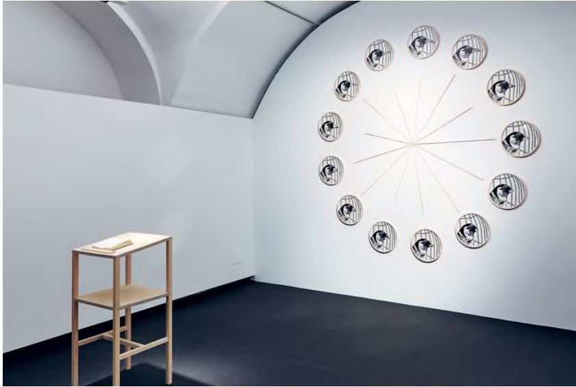
Gosztola Kitti: Ut fringilla , 2021, installáció, fotó: © Biró Dávid / HUNGART © 2021