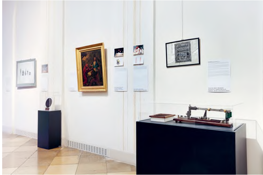
Részlet a Pannonhalmi Főapátság Szubjektív archívum című kiállításából

a lelki, fizikai és szellemi munka arányos beosztása – az ebből származó Ora et Labora ( Imádkozz és dolgozz ) mára a bencés szerzetesek jelmondatává vált. Útmutatásait követően a bencés kolostorokban az apát vezetése alatt szerzeteközösség jön létre, a szerzetesek engedelmességet fogadnak – mindennapjaikat pedig az imádságnak, a munkának, az olvasásnak, az étkezésnek és az alvásnak dedikált időszakok töltik ki. Mondhatjuk, hogy szemlélődő élet a szerzeteseké, van azonban egy fontos iránymutatás, amely nem maradhat ki a szemlélődő és aktív életről kialakított gondolatmenetből: a legszemlélődőbb életben sem szabad megszakítani a kapcsolatot a külvilággal. A vita activa és a vita contemplativa helyes arányának keresése adhat kulcsot a Pannonhalmán most látogatható Láthatatlan spektrumok és a hozzá szorosan kapcsolódó Szubjektív archívum című kiállításához. 1 A Pannonhalmi Bencés Főapátság gyűjteménye köré épülő kiállítások a vallásban és tudásban való elmélyülés eredményeképpen felépülő archívumot, múzeumot és könyvtárat – pontosabban a tevékeny életeknek köszönhetően fennmaradt elemeiket állítják középpontba. A kiállítások talán éppen arra a kérdésre keresik a választ,