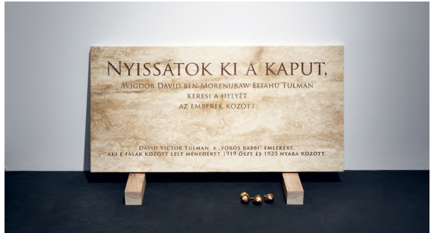
KissPál Szabolcs: Nyissátok ki a kaput! , 2021, süttői mészkő, 100 × 55 × 4 cm, fotó: © Biró Dávid / HUNGART © 2021

A Szubjektív archívum bevezeti a látogatót a monostor lakóinak lelkeségébe, olyan pillanatokba, amelyeket mi, kívülállók még hallomásból sem ismerhetünk. A Láthatatlan spektrumok pedig olyan, látszólag egymástól távol eső témákat és területeket fűz össze, amelyek mind a lokális, mind az egyetemes egyháztörténethez kínálnak izgalmas, meglepetésekkel teli (sokszor fikcióval átítatott) alternatív olvasatokat. A kutató szerzetes és a kutató művész fogalma nem új keletű, fúziójuk által azonban különleges, a hit, a racionális tudás és a képzelet izgalmas egymásra vonatkoztatása született meg a Pannonhalmi Főapátság kiállítótereiben.