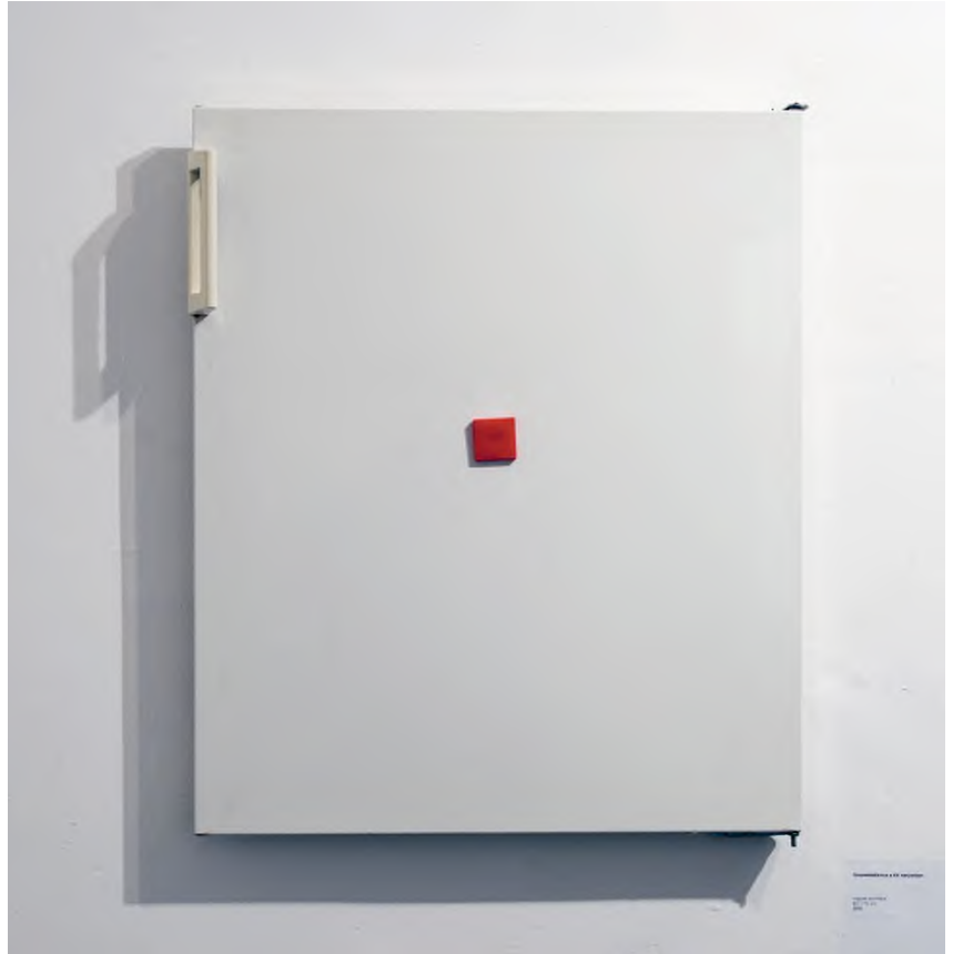
Pólya Zsombor: Szuprematizmus a XII. kerületben , 2011, vegyes technika, 80 × 70 cm / HUNGART © 2021

McLuhan is the Message (Az üzenet: McLuhan) című régebbi, 2011-es, Fehér Áronnal közösen kitervelt munkájából is fény derül arra, hogy Pólya tisztában van a művészetelmélettel, a médiaelmélettel, és az efféle megközelítéseket nemcsak hangzatos magyarázatként helyezi alkotásai mellé, hanem ki is próbálja őket a gyakorlatban; egy-egy művét akár ezek működésére építi fel, mint a McLuhan esetében is. A 20. századi médiateoretikus elmélete alapján a televízió hűvös médium, mert rossz minőségű képet közvetít. Forró médium azonban a fotográfia és a mozgófilm, mert az celluloidra készül, és így majdnem tökéletes. A két alkotó ezzel a felvétellel foglalkozott Woody Allen Annie Hall című filmjét használva, mert abban maga McLuhan is szerepel. Ugyan mozifilmről, így forró médiumról van szó, de amikor felkerült a YouTube-ra hűvös médiummá vált a minőségromlás által. Pólyáék analóg technikával lefotózták a képernyőt, tehát újra forró médiumot használtak. Ezután kinyomtatták a képeket, így váltogatva a médiumok forró és hűvös minőségeit. A nyomtatást