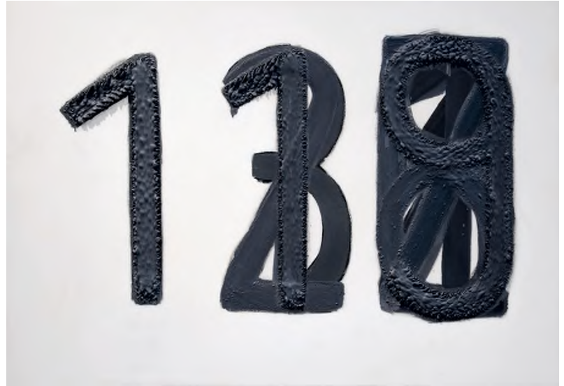
Pólya Zsombor: Kilóim hazugsága , 2011–2012, olaj, vászon, 70 × 100 cm / HUNGART © 2021

kerülnek, hiszen harmincegy nap alatt készült el velük. A második hónap képére ezen elv alapján 1220 Ft került, és így tovább. Bárki kivághat egy sniccerrel a megfelelő összeg megfizetése ellenében a festményből, még a műgyűjtéshez korántsem elegendő büdzsével rendelkező művészetkedvelő is. Izgalmas felvetés: tekinthető-e önmegsemmisítőnek ez a mű úgy, hogy valójában a látogatók semmisítik meg? Abban az értelemben mindenképp öndestruktív, hogy elfogyasztására a művész maga szólítja fel a befogadót.