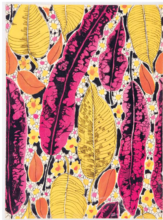
Suzie Zuzek Tropical Harvest (Trópusi szüret) című mintaterve, amelyet később a Lilly Pulitzer cég használt fel, 1973. november 5., ecset, akvarell, toll, fekete tinta, grafit, papír, 383 × 282 mm, Cooper Hewitt, Smithsonian Design Museum, New York

Suzie Zuzek for Lilly Pulitzer: The Prints That Made the Fashion Brand (Suzie Zuzek Lilly Pulitzer-nek: a minták, melyek divatmárkát teremtettek), Cooper Hewitt, Smithsonian Design Museum, New York, 2022. január 2-ig