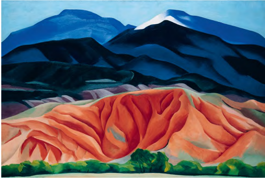
Georgia O'Keeffe: Black Mesa Landscape, New Mexico / Out Back of Marie's II (Black Mesa látkép, Új-Mexikó / Marie háza mögött II.) , 1930, olaj, vászon, 61,6 × 92,1 cm, Georgia O'Keeffe Museum, Santa Fe