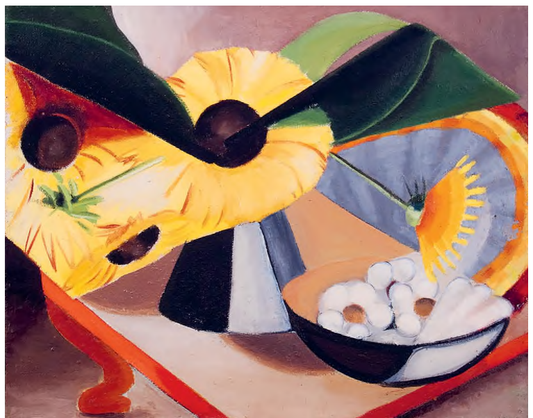
Dusti Bongé: Sunflowers (Napraforgók) , 1944, olaj, vászon, 41 × 51 cm © Dusti Bongé Art Foundation

ségkívül tőled függ. Ez a mélyen egyedi dolog a valódi személyiséget, nem pedig a felszínes burkot veszi körül. Mindig is úgy éreztem, hogy a gondolatok, ötletek és érzések nyílként haladnak előre – egyenesen a belső falat célozzák.”