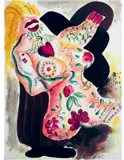
Dusti Bongé: Untitled (Surrealist Nude Female with Tattoos) (Cím nélkül [Szürrealista akt tetoválásokkal]), 1945, vegyes technika papíron, 33 × 25,4 cm © Dusti Bongé Art Foundation

Retrospektív kiállításán nagy méretű festmények és kis akvarellek, valamint három szobor is látható. „A belső fal két-