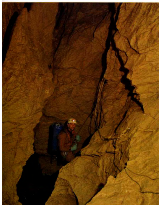
Kötélhíd -800 m-en