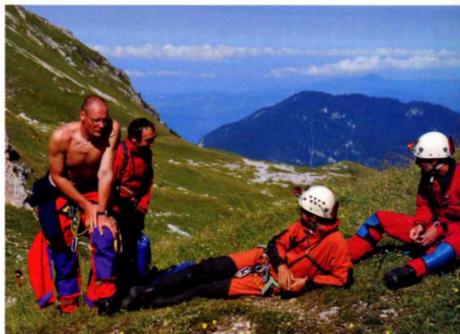
Izgalommal teli várakozás az első leszállás előtt – a magyar négyes