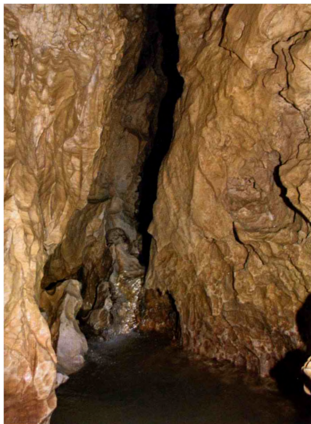
Meander és víz