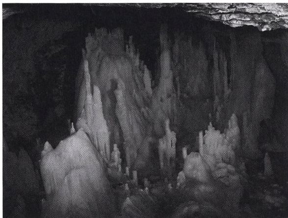
A Szkerisórai- (Aranyosfői)-jégbarlang

Negyedik napon a Meziádi- (Mézgedi-) barlangot látogattuk