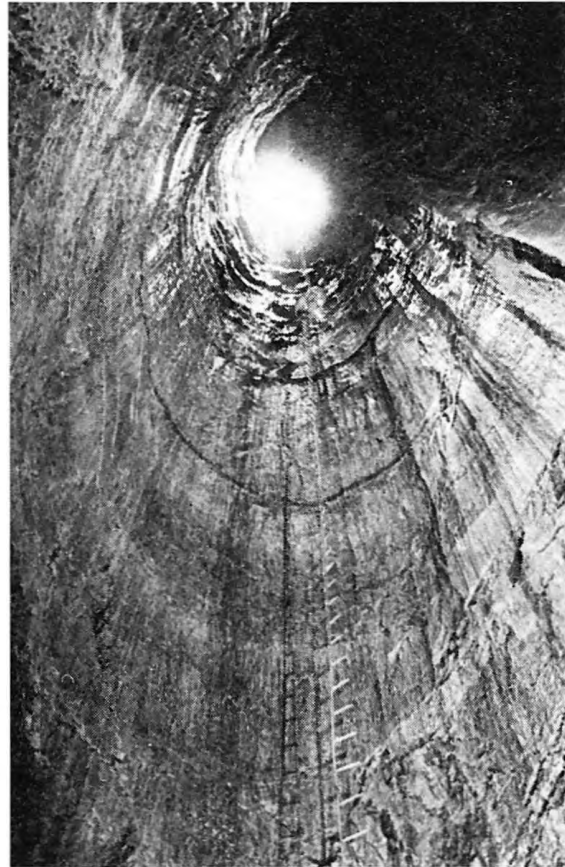
Csőformájú hatalmas akna a Ghar Parauban

a Kuh-i-Parau barátságosnak bizonyult, szinte csak be kellett sétálni a fennsík legfeltűnőbb, száraz víznyelőjének fenekén ásitó barlang-nyílásba, a Ghar Parauban. Ezen az első vállalkozáson — az expedíció teljes felszerelését igénybe véve — kürtök során át 740 méteres mélységig nyomultak a kutatók. Itt újabb mélység állta útjukat, melyet további felszerelés hiányában ezúttal nem tudtak meghódítani. A 740 méteres mélység eléréséhez huszonöt, 6-tól 42 méter mélységű kürtőbe kellett aláereszkedni. A barlang alsó része kellemetlenül szűk, magas hasadék. A huszonötödik akna leküzdése után valamivel tágasabb terembe értek a kutatók;