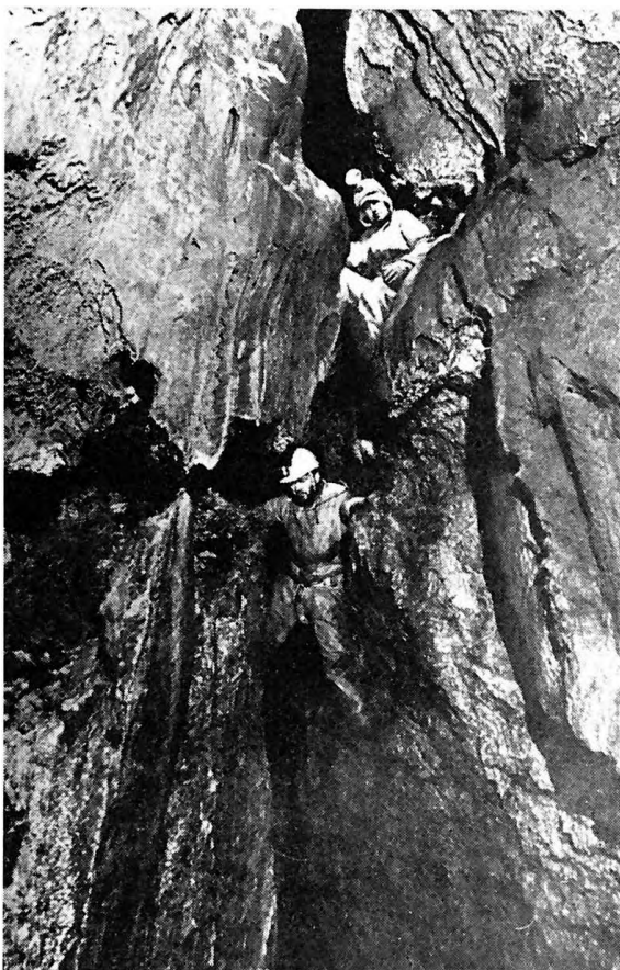
Az angol kutatók 26 aknán ereszkedtek le összesen 750 m mélységbe. (Az ábrák D. Judson: Ghar Parau c. könyvéből készült reprodukciók.)

az utolsó, ezúttal be nem járható kürtő alján patak csatlakozott a barlangba.