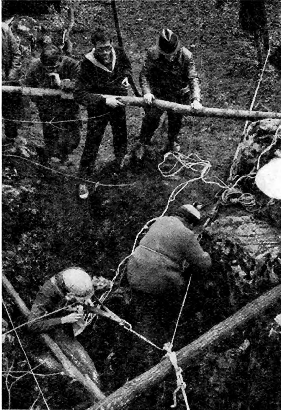
A kitüntetett „Vecsem-brigád” néhány tagja a zomboly szájánál

felfedezésének kezdeményezője, szervezője és vezetője volt.