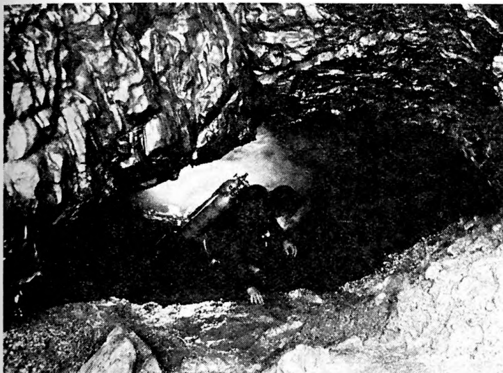
A járat vízszint alá bukik...