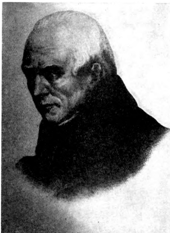
1. ábra. Stanisław Staszic (1755–1826) arcképe

A hatodik teremből jobbfelé menve egy hatalmas folyosóhoz jutunk, amely mintegy 16 öl magas és 15 öl szélességű. Közepén sebes patak rohan, amelybe a különböző oldalokról több kisebb ér ömlik. Helyenként sziklából fakadó forrásokat láthatunk, máshol néhány öl magas dombokat lehet találni, és ezeken szinte fatörzseként meredeznek a csodálatos