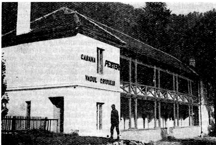
Turistaház a Révi-barlang bejárata mellett.