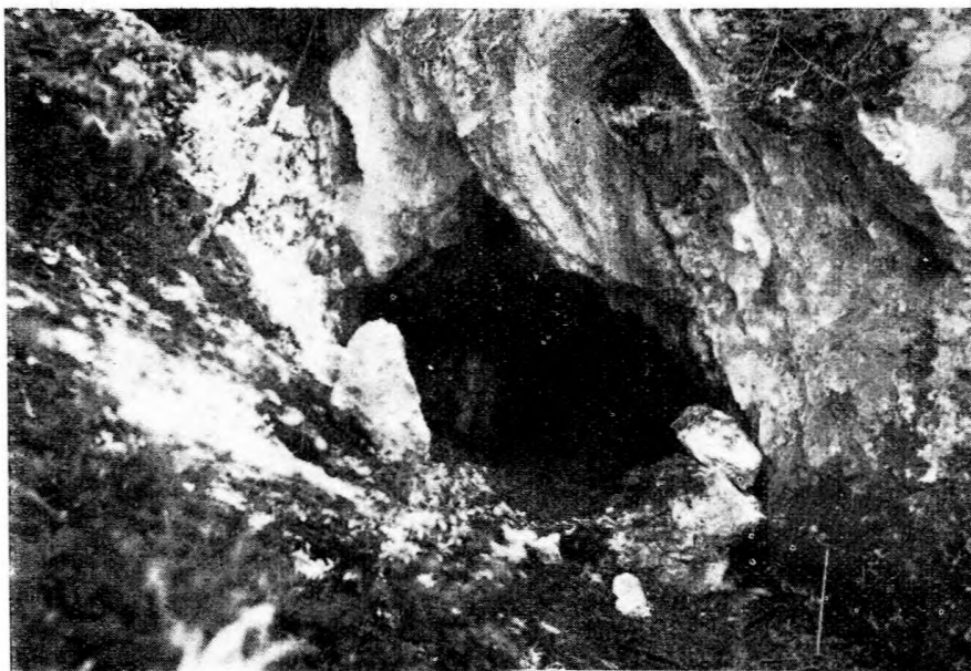
3. ábra. Az Odvaskői-barlang bejárata. (Bertalan Károly felv., 1940. aug. 10.)

kovadarabkákon semmi megmunkálás nyomait nem lehetett felfedezni. A feltárás nem terjedt ki az egész feltöltésre, így a régészeti eredménytelenség nem jelenti, hogy a teljes felkutatás során kultúrnyomok ne kerülnének majd elő” [5].