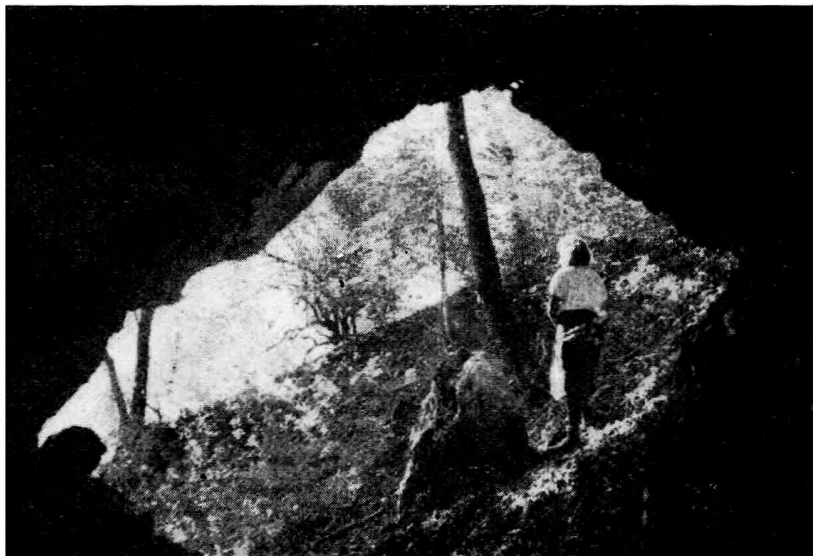
4. ábra Kilátás az Odvaskői-barlangból. (Bertalan Károly felv., 1941. júl.)

Простирающаяся по середине Задунайского края гряда гор Баконь располагает многочисленными пещерами, 15—20 из которых могло быть пригодным для вселения человека. Археологические поиски были начаты в 1911 г. и до наших дней сделаны были более или менее крупные раскопки в 12 пещерах. Между 1950 и 1953 гг. были проведены исследования М. Рошкой. Найденные при этом 14 или 15 предметов, отнесенных к палеолиту, оказались недостоверными, так что в горах Баконь нам неизвестно памятников палеолитикума. Однако, в большинстве раскопок были найдены предметы неолитикума, медного бронзового и ранне железного веков, а также римского (I—IV вв. нашей эры) или венгерского (X—XIII вв. нашей эры) раннего средневековья, соответственно. Присутствие памятников этих веков объясняется тем, что во время невзгод населения всегда охотно приютилось в рассматриваемых пещерах.