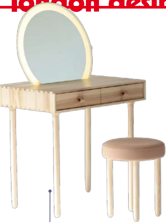
CODOLAGNI DESIGN STUDIO - AVIGNON NO.1 PIPEASZTAL VILÁGÍTÓ TÜKÖRREL