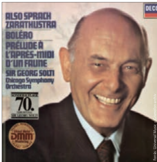
Solti döntően hozzájárult a modern amerikai zenekari hangzások kialakításához. Képünkön a 70. születésnapjára, a Chicagói Szimfonikusokkal kiadott Richard Strauss-album borítója

A végén (ünneprontásként?) álljon itt egy kis – szubjektív – összehasonlítás. Mostanában az évfordulók korát éljük – a magyar karmesterek esetében különösen: Végh Sándornak is idén van a centenáriuma; Reiner Frigyes jövőre lesz 125, Széll György 115, s ha évfordulója nem igazán kerek, egy említést megérdemel. Az emigráns karmesterek közül