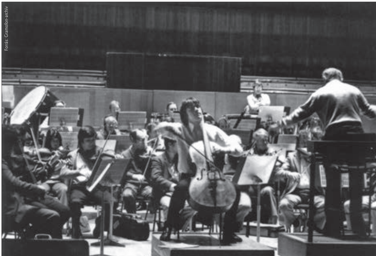
Solti György próbál: a csellószólista Julian Lloyd Webber

Ugyanilyen sorsszerű, hogy övé lesz az első stúdióbeli Ring-ciklus: Furtwängler élete túl rövidnek bizonyul, hogy (legalább fél évtizeddel hamarabb) megvalósítsa Walter Legge álmát. Solti pályáját a technikátörténet is segíti: az LP, majd hamarosan a sztereó hangrögzítés megjelenése azt is jelenti, hogy fel kell venni a teljes repertoárt. Soltinak – aki ötven évig marad a Decca kizárólagos művésze – továbbra is oroszlánszerep jut az operarögzítésben. Az évfordulós újrakiadásban Wagner 36, Verdi 16, Richard Strauss 15 CD-t tesz ki, de jut 15 Mozartnak is. Ezek ma is etalon-értékű előadások, még ha egyikből-másikból (vagy szinte mindegyikből) tudunk is olyat mondani, amelyik közelebb áll hozzánk, mint Solti értelmezése. Igen, az övé, mert az operákban is az szól, amit ő akar – de nem mindig, ki szóltatja meg. Karajan egyik-másik csodálatos kései operafelvételének értékéből épp az von le, hogy az énekesek hallgathatatlanok – Soltival ilyesmi nem fordulhatott elő: az énekesekhez alighanem ő értett jobban. Operakarmester volt? Egyrészt igen: talán ebben alkotta a legtöbbet, a legmaradandóbbat, ezzel nyerte a legtöbb díjat és a legtöbb állást. Operakarmesterként tett a legtöbbet a zenei életért – kevés helyen volt „csak úgy” karmester, a legtöbb operaházban művészeti vezető, zeneigazgató is volt, aki repertoárról, énekesekről, struktúráról döntött. Ha a Covent Garden ma a világ legjobb operaházai közé számít, abban Solti keze és energiája benne van és marad is még sokáig.