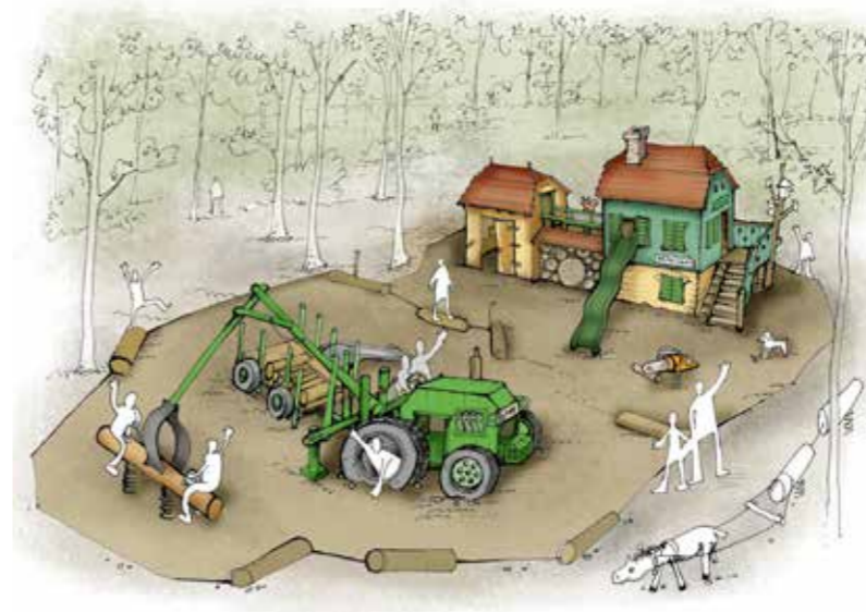
▲ Erdész játszótér terve

A mi játszótereinkben is van hinta, csúszda és mászóka, de ezek tartalmi és formai megfogalmazása az adott helyhez szervesen igazodik. Olyan játszótér csinálunk, amely jellegzetes, és csak ott, azon a helyen lehet. Éppen ezért szeretnek bennünket az erdészetek, a nemzeti parkok, de az ország valamennyi állatkertjében is dolgoztunk már. Mindenki tudja például, hogy ez a veszprémi állatkert szavannás repülő játszótér, ahová árverésen egy valós repülőgépet vásároltunk, és átalakítottuk 7 méter magasságig használható, ikonikus játszóeszközzé. Mindenki szeretne kuriózumot, mi pedig a helyhez igazodva meg tudjuk ezt adni. Szeretem a kihívásokat, mindig tanulunk belőlük és fejlődünk. A Hortobágyra például biztosan pulikutyát és darvakat teszünk, és nem északi pockot, ami a Fertő-Hanságba való. Vagy Lajoskomáromban, ahol Euró-