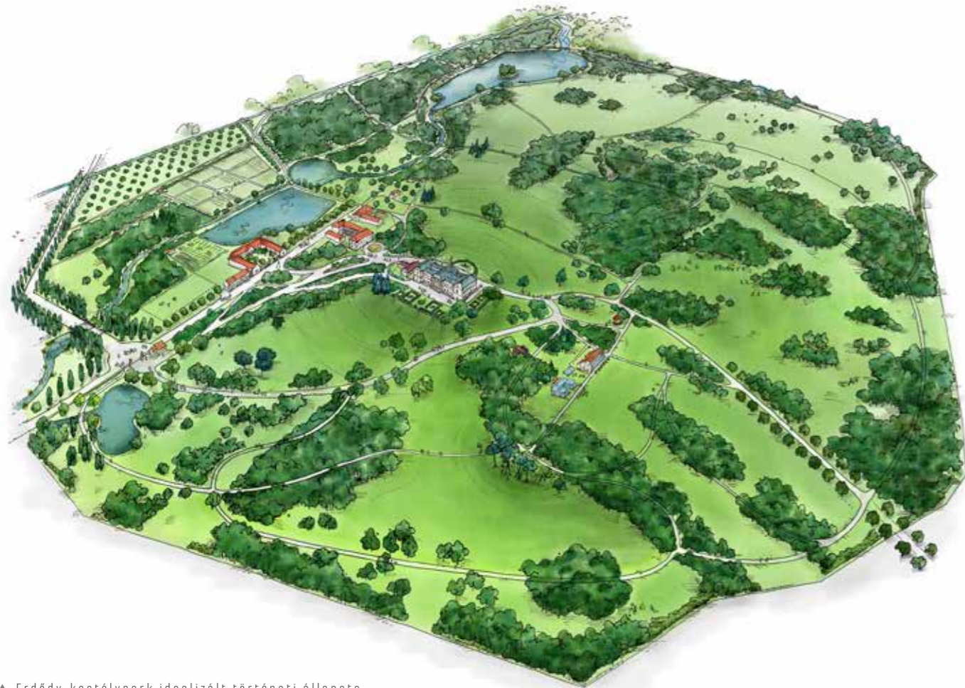
▲ Erdődy-kastélypark idealizált történelmi állapota, Doba-Somlóvár

kezdtek kavarni bennem. Úgy éreztem, mintha egy életműdíjat kaptam volna. De hiszen én még nem vagyok „kész”, én még nagyon sok mindent szeretnék letenni az asztalra. Még ne írjatok le, még ne adjatok ide!