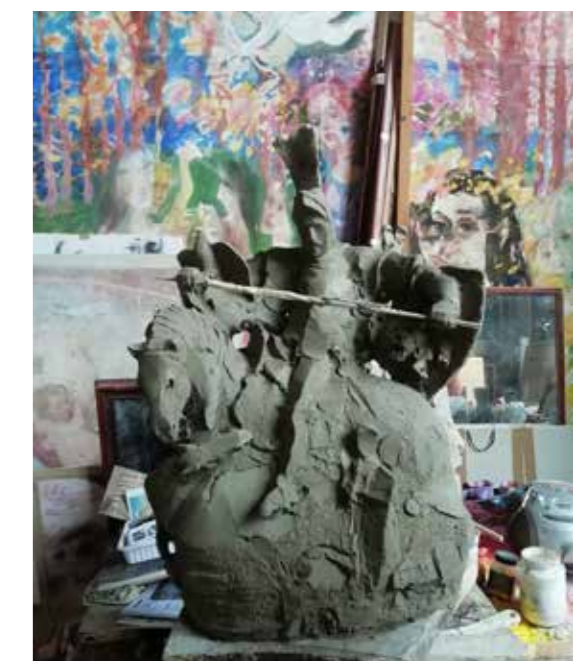
▲ A lovagkor apoteózisa , 2023

Amikor a bolgár kulturális és művészeti állami bizottság megcsinálta a trák kincsek kiállítását a Szépművészetiben (1978), akkor a magyar állam szerette volna viszonzni ezt a gesztust, és velem egy másolatot festettek Jan Matejko: A várnai csata című festményéről. Kérdezték, hogy mennyi idő alatt fogom ezt lemásolni,