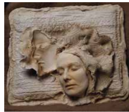
◀ Álom, 1984

A fehér négyzet. Érezzük, hogy egy demokráciában nem létezik olyan kormányzat, vagy olyan kormányzati döntés, amit az ellenzék helyeselné. A fehér négyzet ideológiája. Én azért nem tudom magamévá tenni a fehér négyzetet, mert én a fehér négyzetet csak folytatni tudom. Oly módon, hogy magam elé veszem, mint egy lehetőséget, mint egy szüzi felületet, és festek rá egy remekművet. Aki nem tud festeni, az megmarad a fehér négyzetnél. Nekem az a vitám az absztrakt-nonfiguratívval, hogy előregedtem, mert az úttörői már régen meghaltak. Természetesen az első és a második világháború élményéből táplálkoztak, abból született, de a progresszivitását mára elvesztette. Ugyanakkor rengeteg pénz van benne, örületes pénz. Az általam leginkább tisztelt absztrakt-nonfiguratív festő Pierre Soulages, aki feketékkel fest fekete képeket, literszám