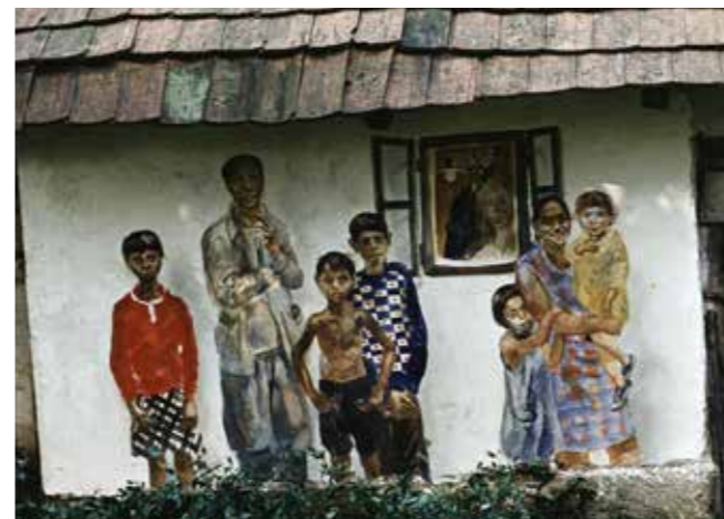
▲ Cigány család, Rakacaszend, 1974

Magától értetődő, hogy az Isten, ahogy megteremtett bennünket, az alapvetően szobrászi. A porból mintázt minket a Jóisten. De a Szentleket úgy adta belénk, hogy kifestett, élővé festett. Engem ez az egyetemeség éltet. Megpróbálom én is mint alkotó, leutánozni a Teremtőt. Valójában én csak másolok.