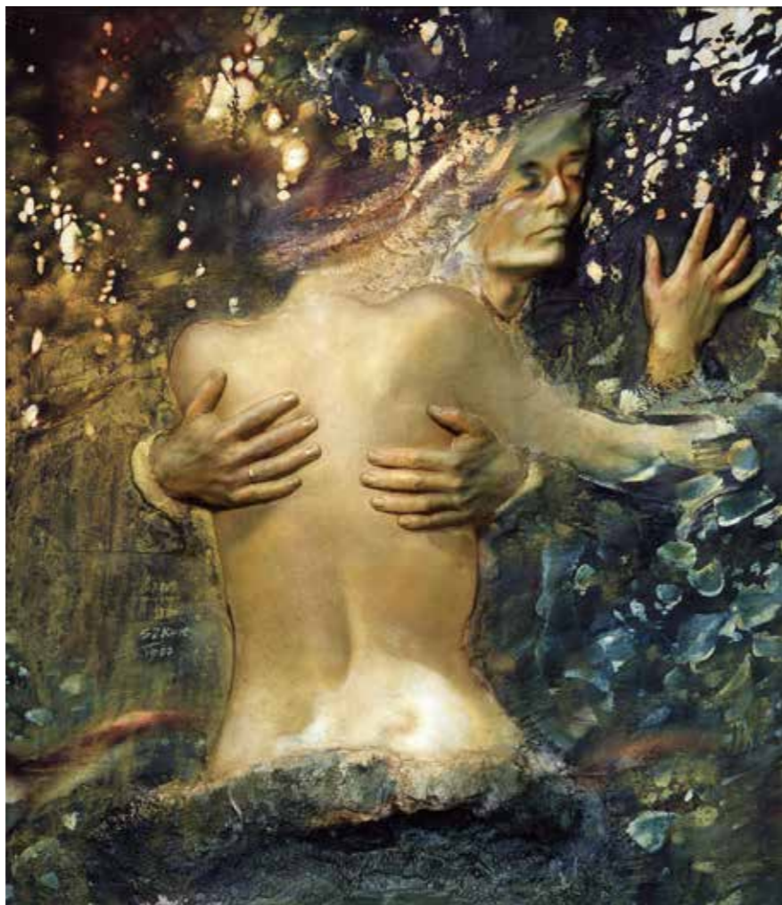
▲ A menyét iramlík, 1986

A másik, ami engem megkülönböztet másoktól, az nemcsak a realizmusom, hanem annak a régi, de az én koromban már el-