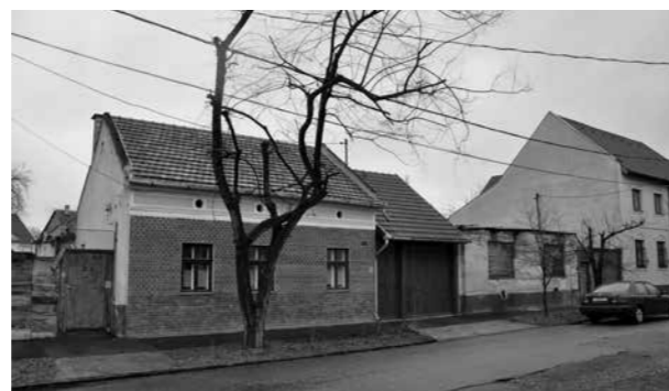
▲ Eredeti utcakép

Építész: Terdik Bálint , Skaliczki Judit Szöveg: Terdik Bálint