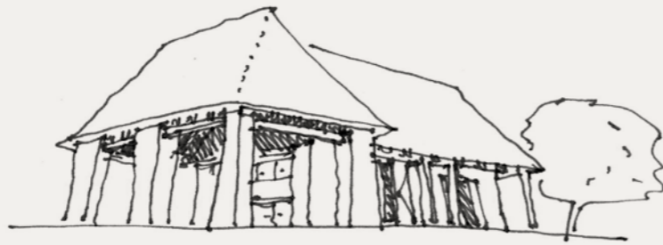
▲ Kerti pavilon vázlata