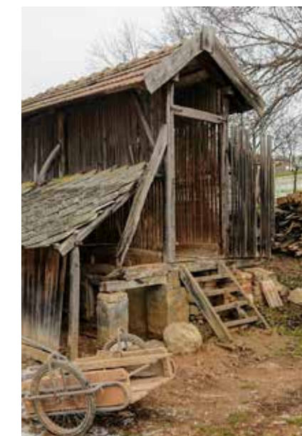
▲ A göré a felújítás előtt

hogy ne húzzuk magunkra a munkánkat. Szerettük volna, hogy legyen külön helye a munkavégzésünknek, ahol vendégeket is tudunk fogadni. Rátaláltunk erre a helyre, ami a lakóhelyünkhöz képest szinte a szomszédban van, de pont elég távolságra ahhoz, hogy papucsban ne lehessen átjönni. Egy olyan élő gazdaságot tudtunk megvásárolni, ahol előző nap még a tyúkok kapirgáltak. Egy olyan, sok generáció óta egy család kezén levő gazdaság volt ez, ahol már csak egy idős néni élt, aki fizikailag már nem tudta ellátni az ezzel járó feladatokat. A néni beköltözött Győrbe a családjához, akikkel egyébként a mai napig jó kapcsolatban vagyunk.