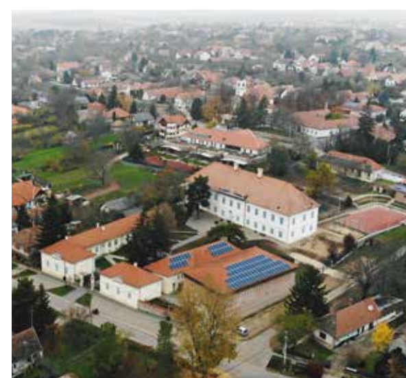
▲ Drónfotó a teljes oktatási és igazgatási tömbről

Építész: Kuli László Szöveg: Erhardt Gábor Fotók: Jandó Zsuzsa, Bozzai Attila Drónfotók: Zajti Ferenc, Osztie Gergely