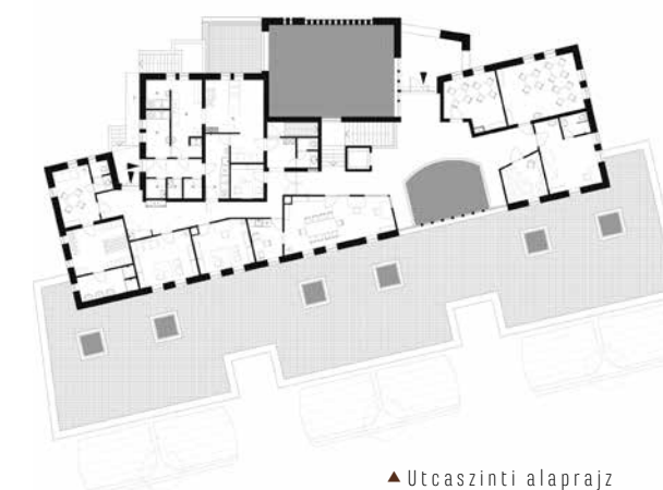
▲ Utcaszintű alaprajz

A csoportszobák az alsó szinten sorakoznak, gyakorlatilag teljesen azonos megjelenéssel, mérettel, tájolással, kiala-