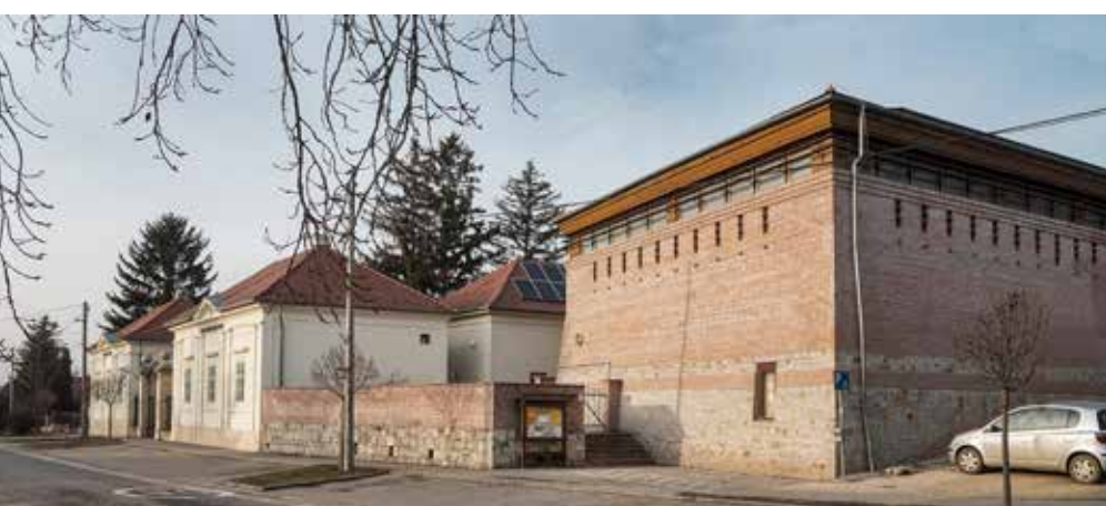
▲ Polgármesteri Hivatal és tornaterem együttese

lépés következett ezután: a szabadtéri sportpálya és futópálya kialakítása a rendház felső, Kossuth Lajos utcai udvarán. Ezt követően, a közelmúltban készült el a sportudvar feletti (keleti) sarokban egy két tantermes iskolaépület (szintén Kuli László tervei szerint), amely az erős tereplejtés miatt szinteltolással valósult meg. Így a Kossuth Lajos utca erős forgalmát a kifelé zárt karakterű épület jól leválasztja az ezáltal csendesebbé váló iskolaudvarról. Az egyszerű, cserépfedésű tetőidom és a téglaburkolatos falak megidézik az alsó sarkon álló tornaterem saroktorony karakterét, folytatva az intézményi terület határait kijelölő építészeti gesztust.