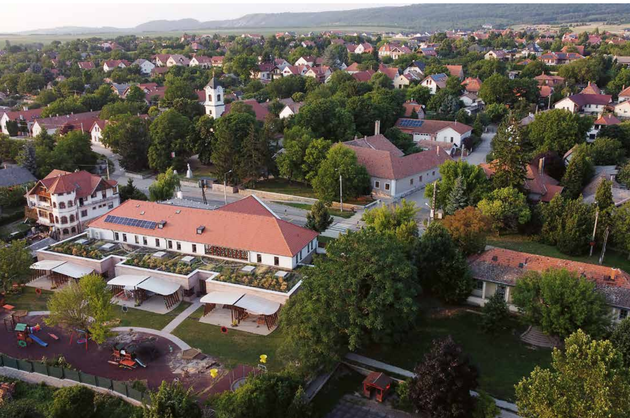
▲ Drónfotó az új óvodaépületről