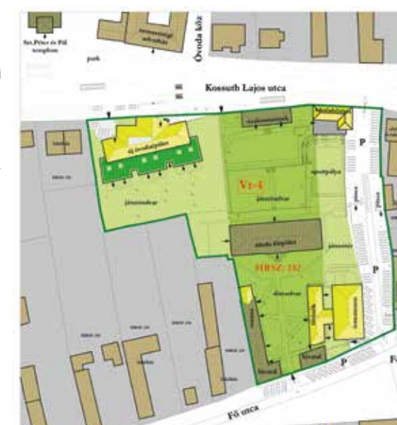
▲ Oktatási és igazgatási tömb helyszínrajza

Nagy örömmre szolgál, hogy a Kuli László tervei szerint megvalósult „Budajenő község oktatási és igazgatási központjának fejlesztése”, egy majd' két évtizedes építészeti „eseménysorozat” az idei évben Pro Architectura díjban részesülhetett. Ez azt mutatja, hogy építészeti közéletünkben a médiacentrikus építészeti nagyotmondások és a szakma megosztottsága által generált belső botrányok mellett jut még figyelem a csendesen, nagyobb távlatokban gondolkodó és tevékenykedő építészeknek és megbízóknak is. Kuli László ráadásul mindezt egy adott közösség szolgálatában teszi, e közösség tagjaként, azaz budajenői lakosként, olyan – mára sajnos elcsépelet, de ettől függetlenül nagyon fontos – fogalmakat állítva praxisa fókuszába, mint a hagyomány és az illeszkedés.