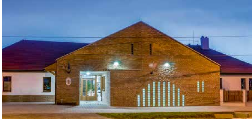
Az új óvodaépület

2007–2008-ban. Az öltözőszárny az egykori rendház elpusztult hátsó szárnyának – értelemszerűen a korhoz igazodóan újrafogalmazott – visszaépítésével valósult meg, amelyhez egy nyaktaggal csatlakozik az új tornaterem. A tégl- és terméskő burkolatú épület saroktoronyként, szimbolikusan foglal teret az együttes déli sarkán. A tornacsarnok – bár mérete jelentős – nem kíván konkurálni a rendház főépületével, így a léptékénél fogva indokoltan a mezőgazdasági épületek architektúrája határozza meg anyaghasználatát, részletképzését. Építészetileg kevésbé jelentős, de az üzemeltetés szempontjából annál fontosabb