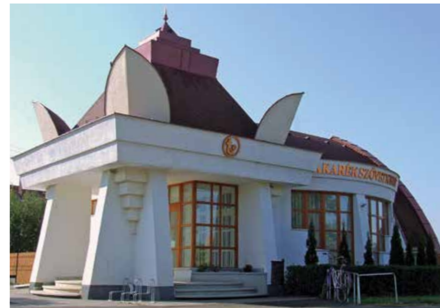
◀ Takarékszövetkezet, Tiszavárkony, 2002