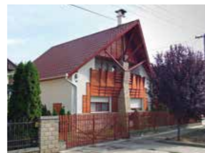
▲ Családirház-átalakítás, Törökszentmiklós, 2006

ben lebontott utcasorokról, épületekről. Azzal szembesültem, hogy már sok eltűnt közülük. Elindultam egy úton. Próbáltam beépítési terveket készíttetni meghatározó területekre. Létrehoztam egy rendeletet a helyi épített örökségünk védelméről. Az önkormányzat pályázatból felújított egy szecessziós polgári házat. Elindítottam az új települési rendezési terv előkészítését. De nem találtam a közös hangot az akkori polgármesterrel, így a 2002-es önkormányzati választások után, mivel ismét bizalmat kapott a választóktól, felmondtam a főépítési megbízást. Közel öt év szünet után, 2007 elején kért fel ismét főépítésznek az akkor új polgármester, és egészen 2014 nyaráig végezhettem szülővárosomban ezt a munkát. Ez a második ciklus már egészen másról szólt, mint az első két év. Bár ebben az időszakban is megtapasztaltam, hogy a politikai akarat nem hagyatkozik feltétlenül az építészeti érvekre, de türelmesebb voltam, mint korábban. Ekkor lehetőséget kaptam Tervtanács működtetésére is. Később azonban a képviselő-testülettel nem kaptunk forrást a működéshez, így a Tervtanács feloszlott. Erre az időszakra esett az Európai Unió 2007–2014-es fejlesztési ciklusa. Sikertelenül olyan pályázatokat megnyerni és a