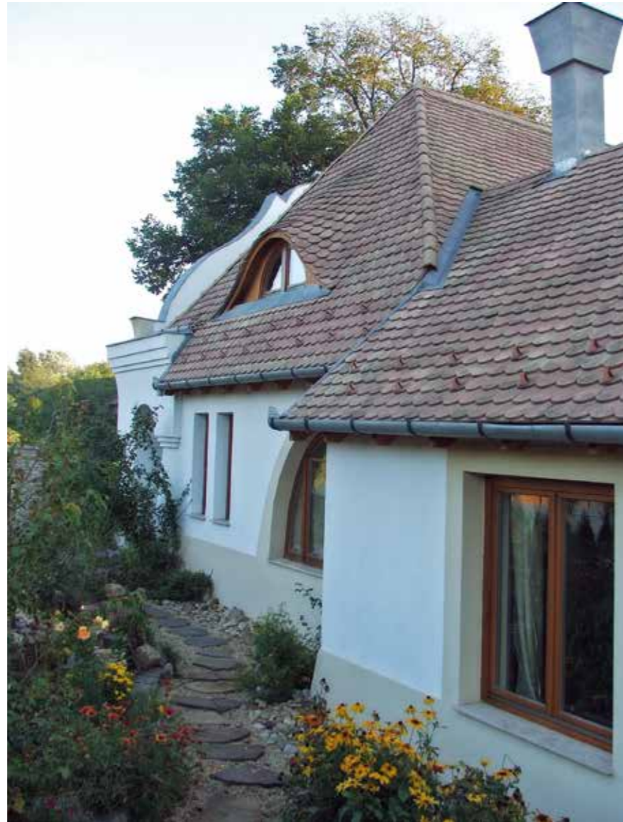
▼ Családi ház, Csömör, 2002