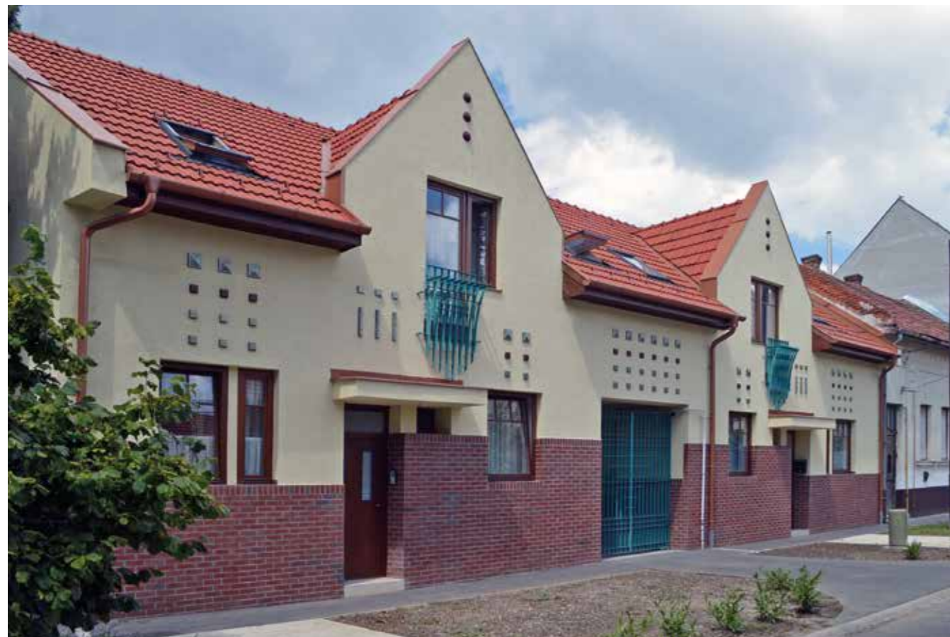
▼ Kétlakásos társasház, Szolnok, 2016

váltó kormányok folyamatosan nyirbálták. Az önkormányzatok, amikor költségvetést terveznek, első helyen mindig a működést tűzik ki célként, azaz a kötelező és az ezek mellé társuló önként vállalt feladataik elvégzéséhez biztosítják a szükséges pénzeszközöket. A megmaradt összeget tudják beruházásokra, felújításokra, fejlesztésekre fordítani. Ezeket nevezhetjük vágyaknak, álmoknak, céloknak, melyek megvalósulásán keresztül méri a lakosok egy polgármester, egy önkormányzati vezetés sikerességét, eredményességét. Az ilyen célok közül a legegyszerűbb dolgok az út- és járdafelújítások, valamint az egyéb infrastrukturális (víz, szennyvíz, csapadékvíz) fejlesztések. A szükséges intézményi beruházások (bölcsőde, óvoda, kulturális épületek, orvosi rendelők stb. építése), közösségi terek megvalósítása, zöldfelület-fejlesztések, meglévő ingatlanok felújítása stb. Törökszent-