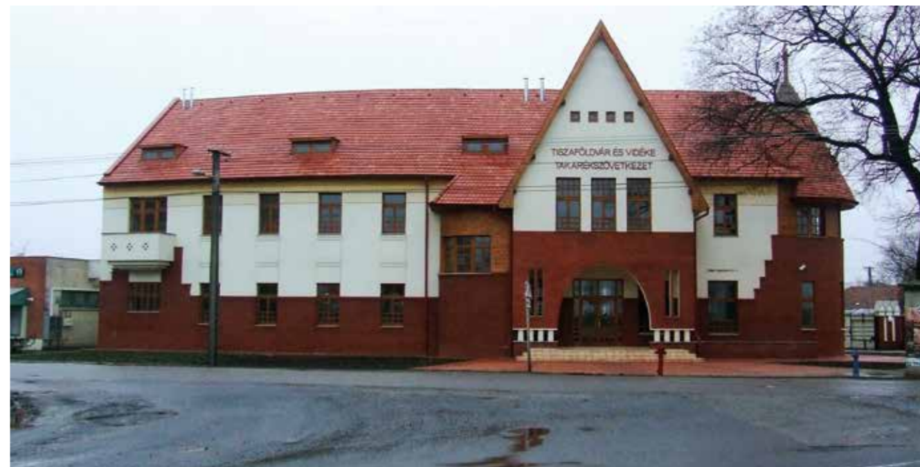
▲ Tiszaföldvár és Vidéke Takarékszövetkezet, Tiszaföldvár, 2008