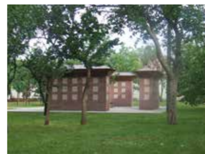
▲ Urnafal, Tiszapüspöki, 2012

valós igények és a lehetőségek között. Bár van átfogó jövőkép, csak a lehetőségekhez igazított feladatmegvalósítókkal tudunk előre haladni. Ugyanakkor a napokban Jász-Nagykun-Szolnok megyére vonatkozóan nagymértékű fejlesztési csomag érkezéséről szóltak a napi hírek, és ezekkel kapcsolatban megkezdődtek a megyei egyeztetések is. Ha ez valóban megvalósul, ha nem is az elkövetkező hét évben, de 2030-ig megérkezhet a 40 milliárd is a városba. A remény hal meg utoljára. Ahogy egy ember életében, úgy egy település életében is a legfontosabb a jövőbe vetett hit, bizalom és optimizmus. Miként lépkedtünk az elmúlt hat évben a lehetőségeink mentén? Tudtunk infrastrukturális fejlesztéseket, felújításokat megvalósítani: helyi utakat, kerékpárutat, szennyvízhálózatot, szennyvíztelepet felújítani, csapadékelvezető rendszert építeni. Önkormányzati ingatlanokat korszerűsíteni, önkormányzati ipartelep fejlesztési, új csarnokkal, épületfelújításokkal: iroda-, öltözőépülettel. Községi sportpályákat építhettünk, megújítottuk a városi piacot. Ez utóbbi városrendezési feladat is volt, ugyanis az addig közutakkal szabdaltságot új