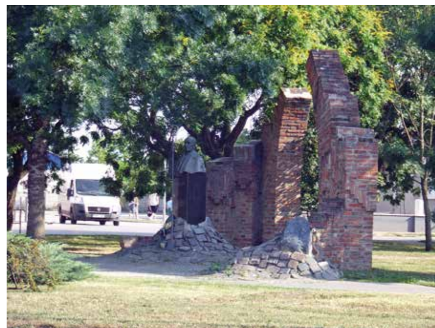
▲ Mindszenty-emlékhely, Törökszentmiklós, 1998

ben lebontott utcasorokról, épületekről. Azzal szembesültem, hogy már sok eltűnt közülük. Elindultam egy úton. Próbáltam beépítési terveket készíttetni meghatározó területekre. Létrehoztam egy rendeletet a helyi épített örökségünk védelméről. Az önkormányzat pályázatból felújított egy szecessziós polgári házat. Elindítottam az új települési rendezési terv előkészítését. De nem találtam a közös hangot az akkori polgármesterrel, így a 2002-es önkormányzati választások után, mivel ismét bizalmat kapott a választóktól, felmondtam a főépítési megbízást. Közel öt év szünet után, 2007 elején kért fel ismét főépítésznek az akkor új polgármester, és egészen 2014 nyaráig végezhettem szülővárosomban ezt a munkát. Ez a második ciklus már egészen másról szólt, mint az első két év. Bár ebben az időszakban is megtapasztaltam, hogy a politikai akarat nem hagyatkozik feltétlenül az építészeti érvekre, de türelmesebb voltam, mint korábban. Ekkor lehetőséget kaptam Tervtanács működtetésére is. Később azonban a képviselő-testülettel nem kaptunk forrást a működéshez, így a Tervtanács feloszlott. Erre az időszakra esett az Európai Unió 2007–2014-es fejlesztési ciklusa. Sikertelenül olyan pályázatokat megnyerni és a