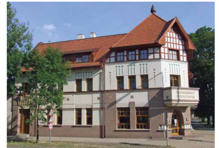
▲ Társasház, Törökszentmiklós, 2008