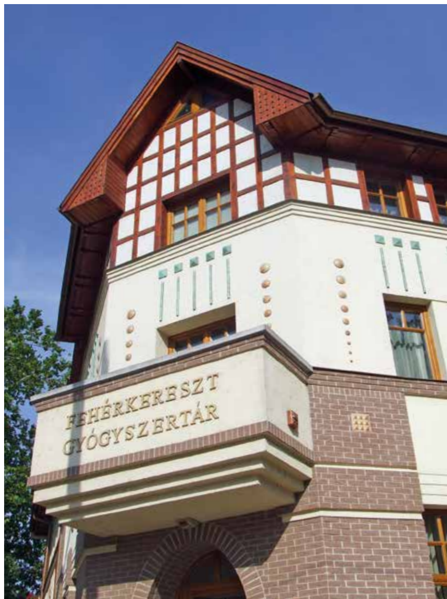
Társasház, Törökszentmiklós, 2008 ▼▶

ahol éled az életedet. De hogy a léptékre kicsit visszatérjek, így, kb. huszonöt év távlatából visszatekintve és értékelve a múltat, az én esetemben úgy látom, hogy valóban más volt a lépték itt, mint ha fiatalon Budapesten maradtam volna.