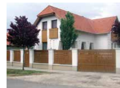
▲ Családi ház, Törökszentmiklós, 2010

Amikor a felvezetődben a kisvárosi lépték vonzalmáról kérdeztél, említettem, hogy ez így soha nem fogalmazódott meg bennem. Ugyanakkor azzal a döntéssel, hogy Törökszentmiklóst választottam lakóhelyemül, és ide kötöttem a munkavégzésem helyét is, léptéket tekintve meghatározom – főképp utólag nézve – az építési lételemet. Törökszentmiklós kisváros. Amikor az önálló pályámat kezdtem, én lettem a városban a hatodik építész, és ez a szám azóta csak csökkent. Utánam senki nem jött vissza, pedig az évek során több fiatal is végzett építészként. Érdekes még, hogy mindenki egyedül dolgozott, ez pedig valahol meghatározza a tervezendő épület léptékét. Bár kezdetben próbáltam kísérletet tenni arra, hogy az egyik kollégámmal összefogjunk, ez nem járt sikerrel. Amikor