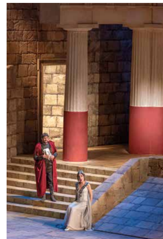
Richard Strauss: Salomé Magyar Állami Operaház / Erkel Színház Díszbemutató: 2020. szeptember 15.

A tervezéskor két fókuszpontunk volt: az egyik a királyi udvar oszlopsorának, ahol a születésnap vacsora és Salomé táncja lejátszott, háttérben a Tetrarcha trónszékének félköríves apszisával. A másik Keresztelő Szent János börtönének színhelye, amelyre Oscar Wilde, az opera alapjául szolgáló dráma szerzője és a Strauss-opera szövegkönyve is ciszternaként hivatkozik. Ez a narratíva a 19. század során publikált, hol tudományos igényű, hol költői hangvételű útibeszámolókon alapul: a romokat meglátogató utazók számára a hegytető közepén lévő, beomlott, kőboltozatos ciszterna maradványai jelentették az egyetlen építészeti támpontot – kézenfekvő volt ezt börtönként azonosítani. A valóságban azonban egyfelől a királyi udvar alatti ciszterna egy kiterjedt vízgyűjtőrendszer részeként, stratégiai víztartalék gyanánt kb. félmillió liter vizet tárolt hermetikusan lezárva, másfelől pedig logikailag is kizárható, hogy egy rabot – legyen bármilyen fontos személyiség – a királyi palotában, és nem a személyzet, illetve a királyi őrség számára épült