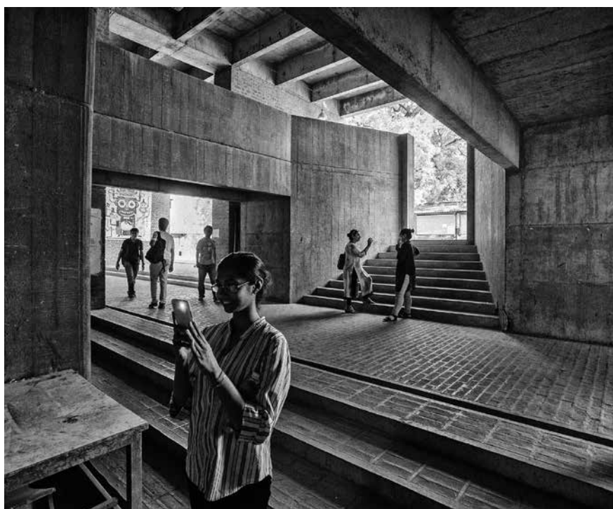
▲ Centre for Environmental Planning and Technology (Környezettervezési és Technológiai Intézet)