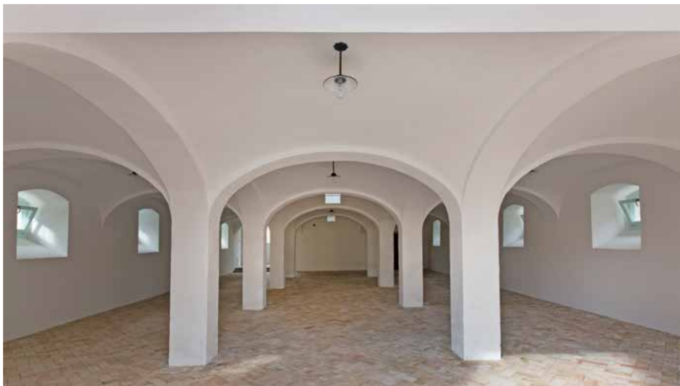
▲ Fotó: Bélavári Krisztina

Az épület helyreállítása, funkcióváltása során az eredeti szerkezeti struktúrát jelentősen megváltoztató átalakításokról kellett dönteni. A meglévő faszervezeteket a szigorú tűzvédelmi előírások miatt cserélni kellett volna, az eredeti fafödémeket helyenként vasbetonra cserélni, a nehéz és durva pallóburkolatok helyett a mai igényeknek megfelelő burkolatot választani. A legnehezebb döntésnek az bizonyult, hogy az eredetileg szintenként egyben lévő tereket az új funkció miatt szét kellett választani... A belsőben az új anyaghasználat következtében a régi, durva ipari-mezőgazdasági és a beépített új szerkezetek izgalmas egyensúlya jött létre.