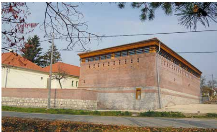
▲ Tornacsarnok. Építész: Kuli László

mot tartani, de valljuk be, ez nem mozgat meg nagy tömegeket, hisz olyasmiről kellene beszélni, ami még nincs. A második ilyen fórumot a kézikönyv munkaközi verziójának bemutatása után tartottuk. Az iránt már nagyobb volt az érdeklődés, hiszen volt mihez hozzászólni. A legtöbben egyébként azt kérték, hogy a település minél több területén erősítsük az ófaluban meglévő építészeti minőséget és hangulatot! Fontos ez a visszacsatolás, hiszen a főépítész elsősorban a közösségért tevékenykedik.