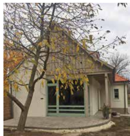
▲ Kockaház átalakítása. Építész: Csóka Balázs

hosszú távon a légrétegek eltüntetésével, föld alá vitelével. Így érhető el, hogy az egykori főutca visszakapja régi méltóságát.