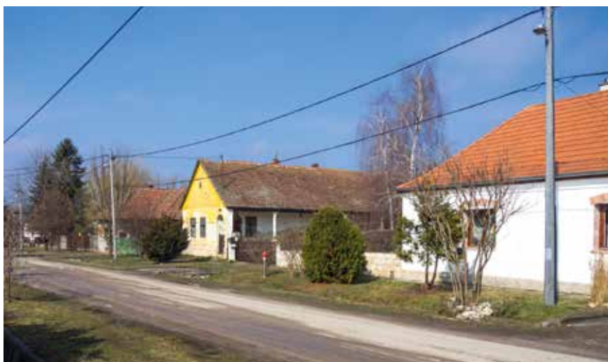
▲ Fő utca